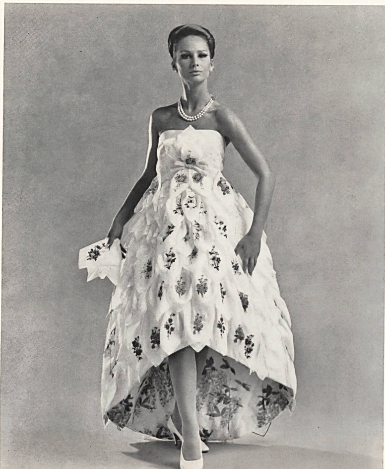
«RECO», REICHENBACH & CIE S.A., SAINT-GALL Crêpe de coton imprimé Printed cotton crepe Modèle Geoffrey Beene