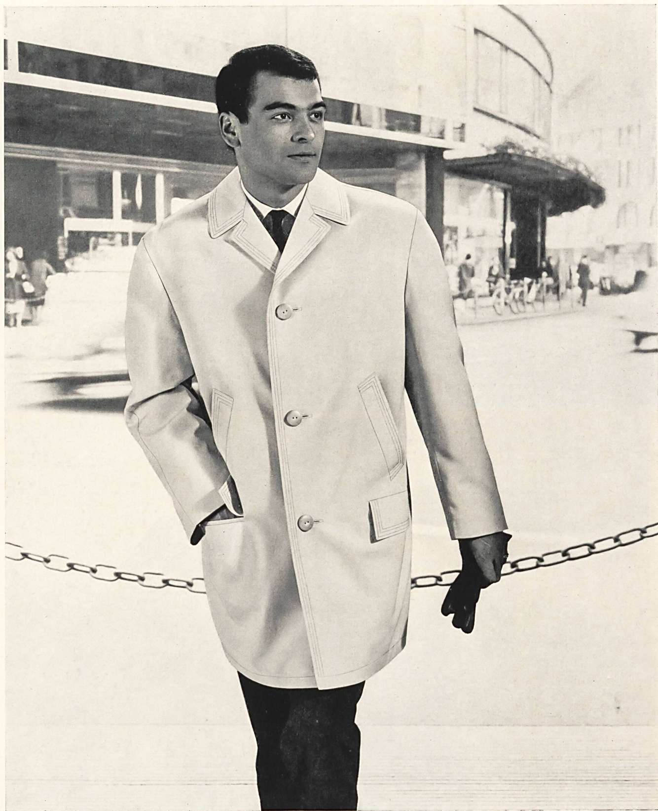
HAUSAMMANN TEXTILES S. A., WINTERTHUR Popeline double-retors Double-twist poplin Popelina con retorcido doble Vollzwirn-Popeline Modèle : Modex AG, Weinfeldern