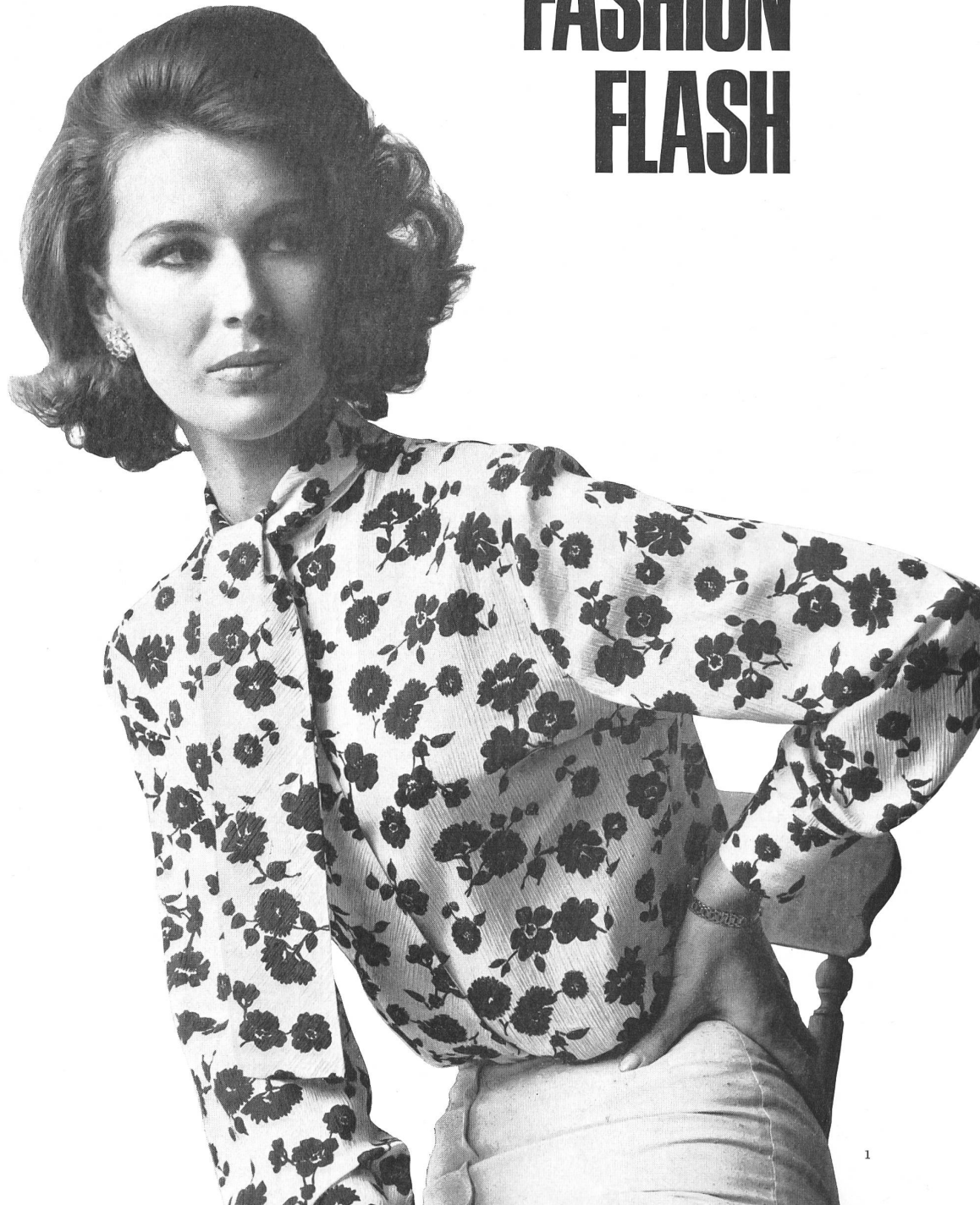
1 Reichenbach & Co. Ltd., St. Gall Printed cotton crêpon Model by Matisse of Bond Street