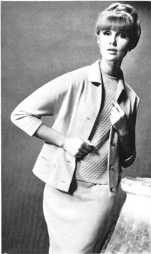
Trois-pièces en tricot wevenit, pure laine mérinos australienne antimites