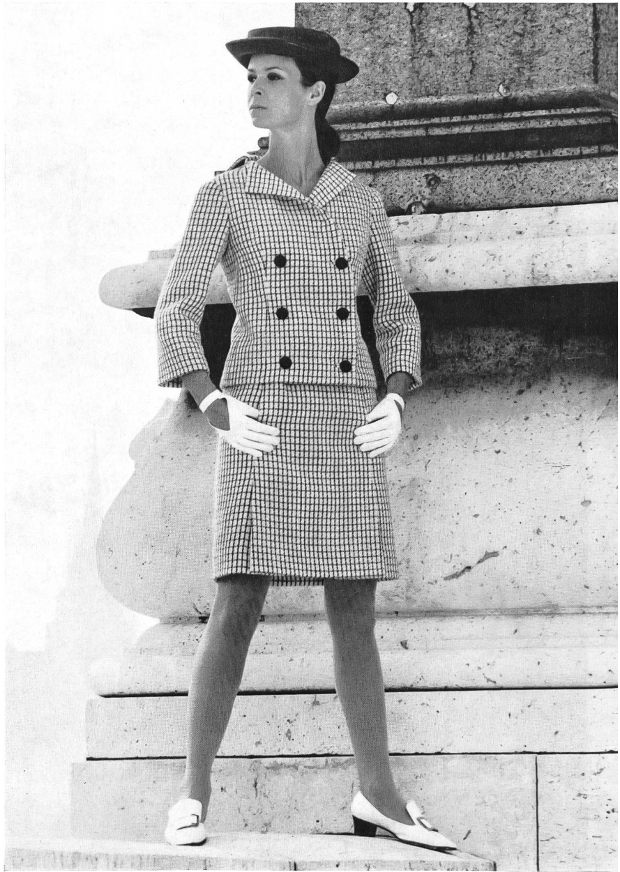
Tuchfabrik Aebi AG, Sennwald Whipcord blanc, pure laine vierge