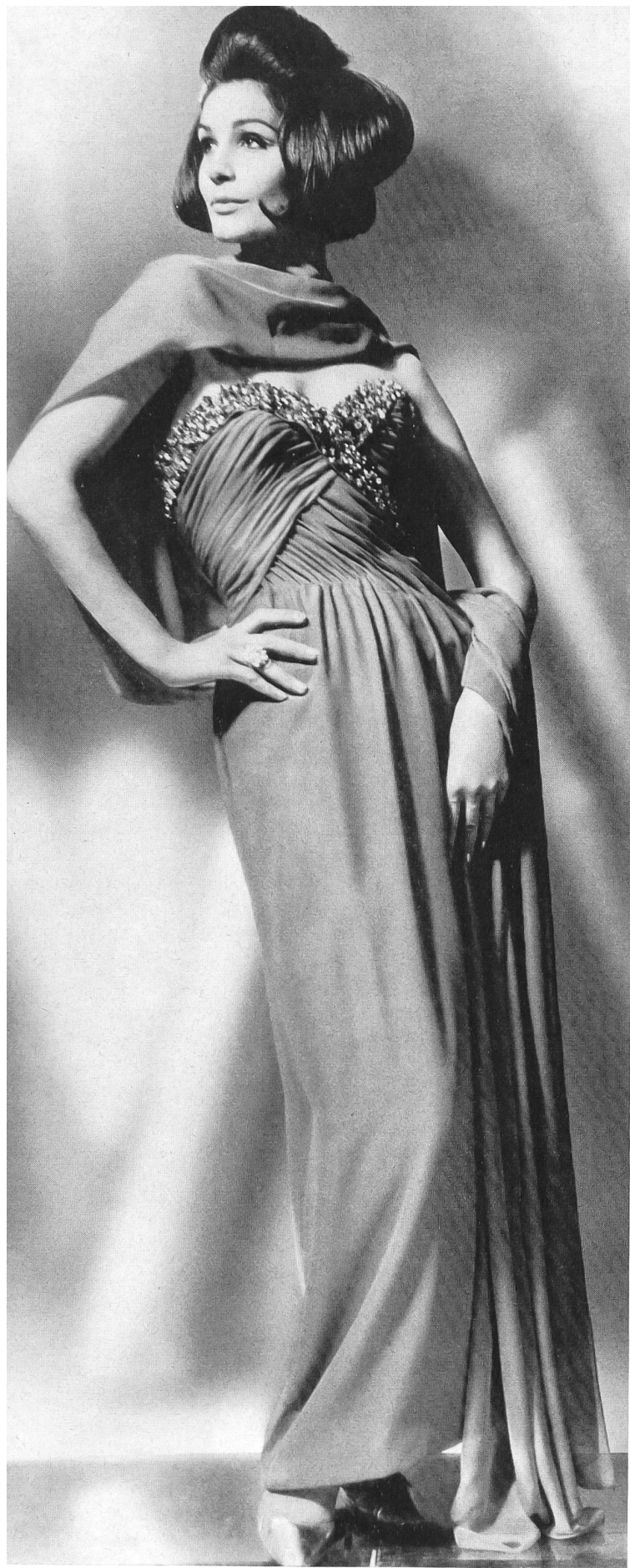
Robe du soir longue en chiffon de soie rouge, brodé à la main Modèle: El-El S.A., Zurich Tissu: E. Schubiger & Cie S.A., Uznach