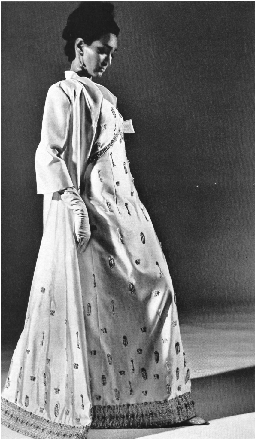
Ensemble du soir long en soie blanche brodée à la main Modèle: Gack, Zurich Tissu: E. Schubiger & Cie, Uznach Broderie: S. Schläpfer & Cie, St-Gall