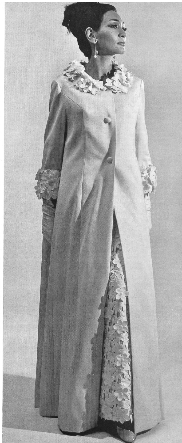
Robe du soir longue avec manteau, en satin double face blanc, broderie découpée Modèle: Leisinger & Cie S.A., Zurich Broderie: A. Naef & Cie S.A., Flawil