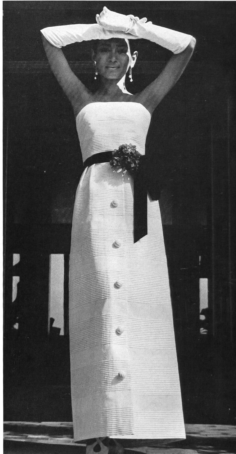
Robe du soir longue blanche, en piqué de coton plissé Modèle: H. Haller & Cie, Zurich Tissu Stoffel: Stoffel S. A., St-Gall