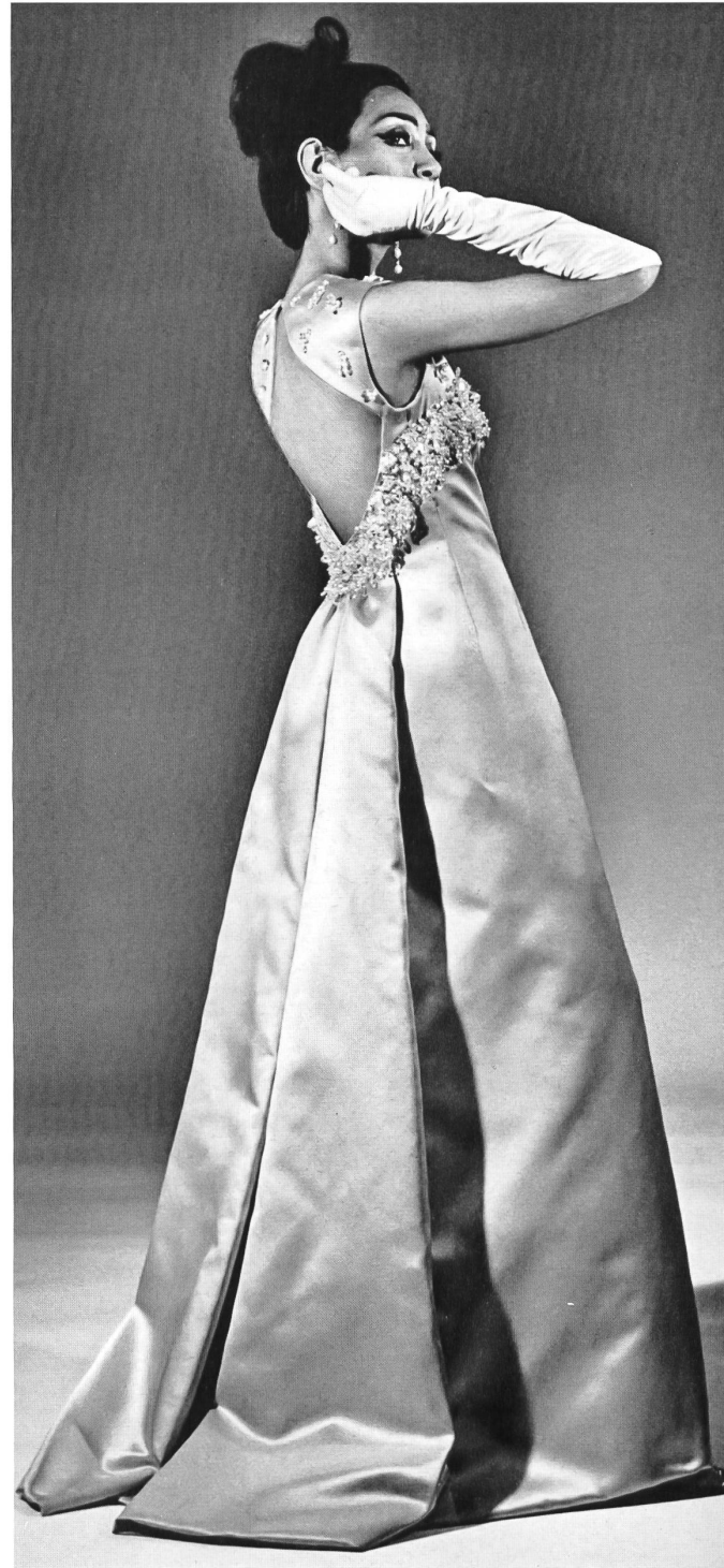
Robe longue en duchesse de soie cyclamen, brodée à la main Modèle: Gack, Zurich Tissu: L. Abraham & Cie, Zurich