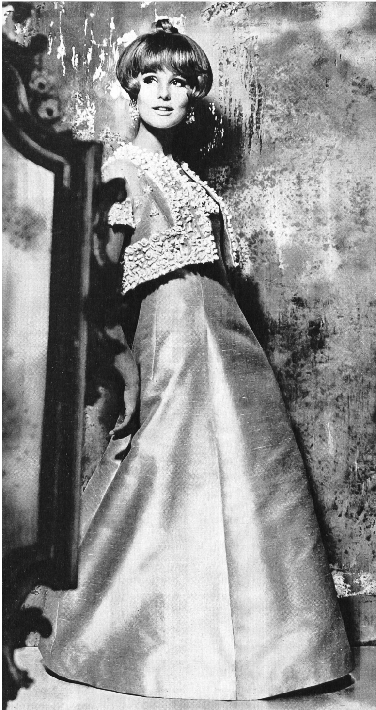
Robe du soir longue en shantung de soie sauvage rose, brodé à la main Modèle: Willy Meyer S. A., Zurich Tissu: Soieries Stehli S. A., Zurich

Robe du soir longue garnie de brillants imitation broderie découpée Modèle: Cortesca S. A., Zurich Broderie: Jacob Rohner S. A., Rebstein