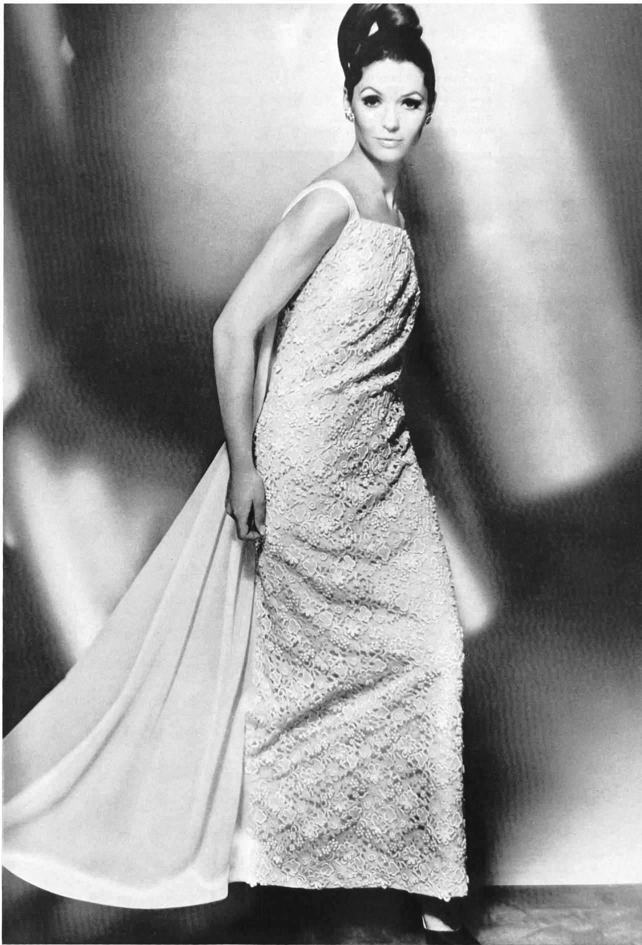
Robe du soir longue en broderie guipure et chiffon de soie citron Modèle: El-El S. A., Zurich Broderie: Rau S. A., St-Gall