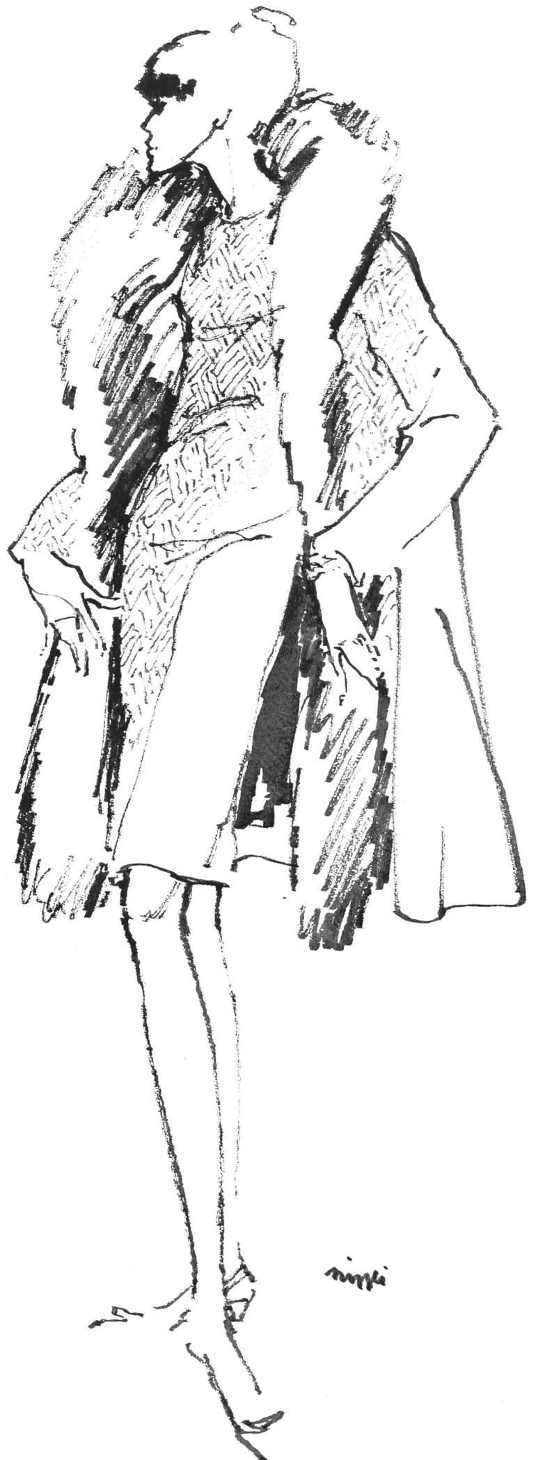
Robe et manteau de cocktail en cloqué praline, garniture de renard Modèle: Cosma S. A., Zurich Tissu: L. Abraham & Cie, Zurich