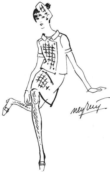
FERIA AT SEVILLA