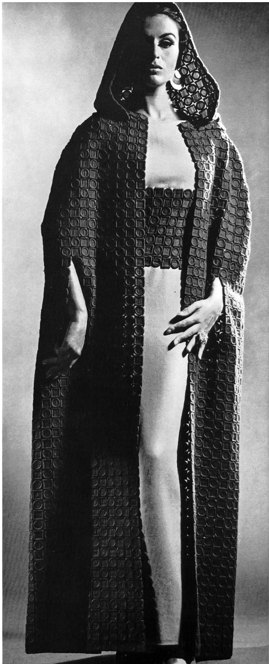
A. Naef & Cie S.A., Flawil/Saint-Gall Broderie lilas, en pure laine vierge Modèle de Wolfgang Klinger