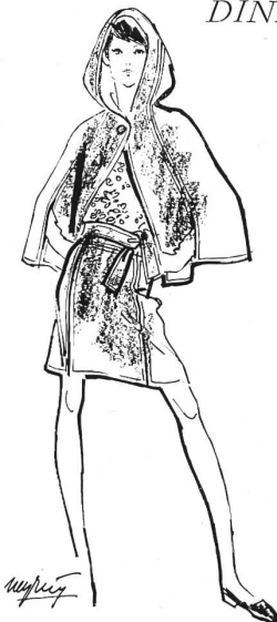
DINNER AT SHEPHEARD'S

Fabriques suisses de drap, Pfungen Tissu natté beige, à dessin nid d'abeilles, en pure laine vierge Modèle de Wolfgang Klinger