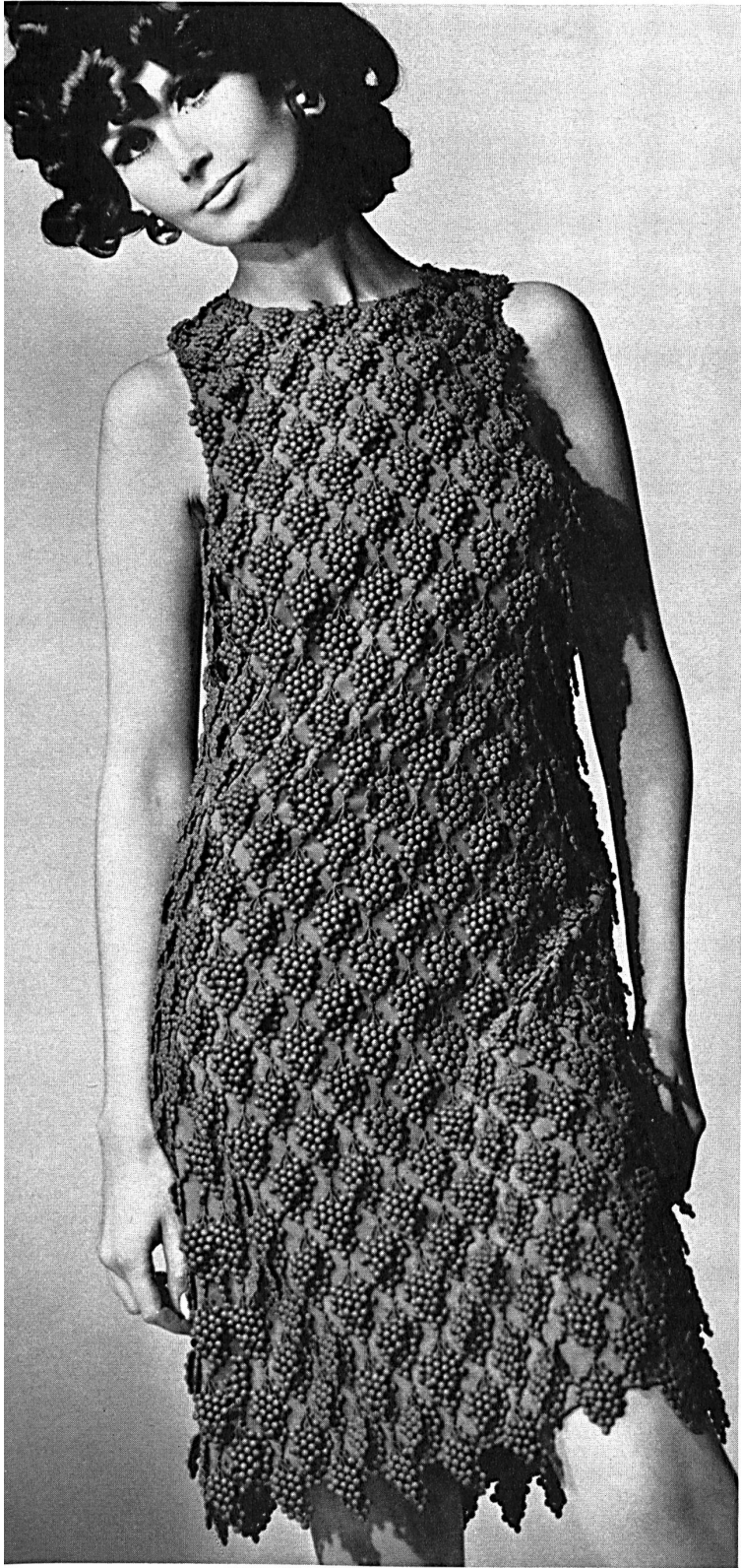
Etched allover by Union AG, St. Gall