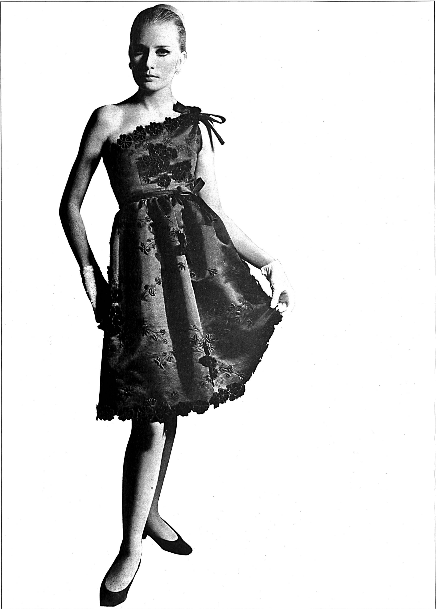
Hubert de Givenchy Broderie de Saint-Gall