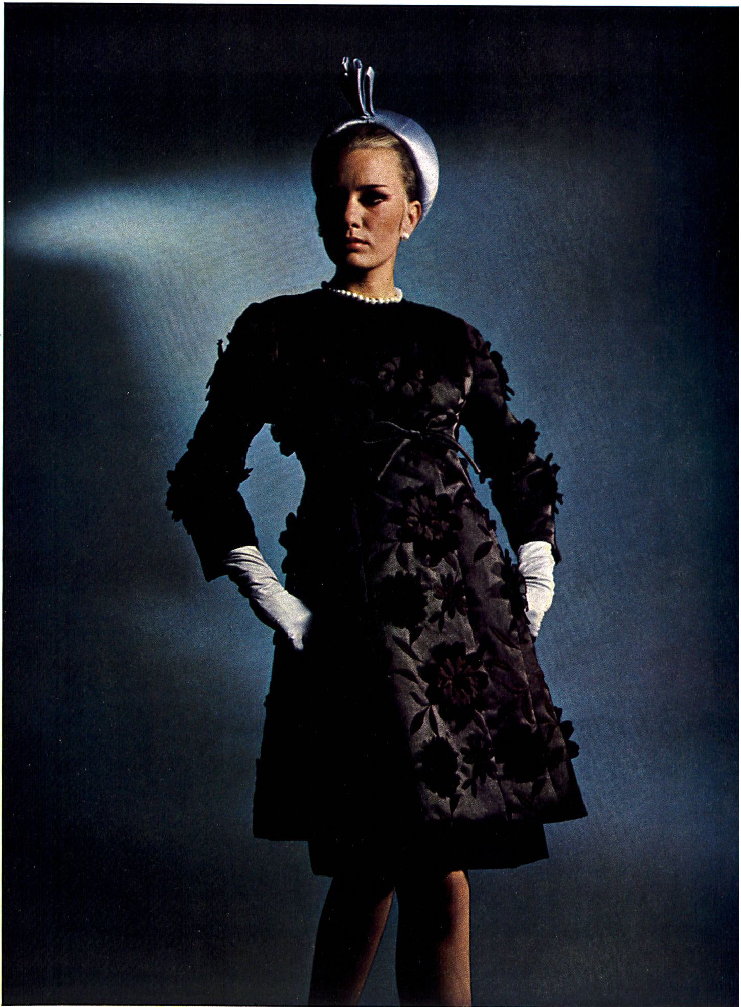
Hubert de Givenchy Broderie de Saint-Gall