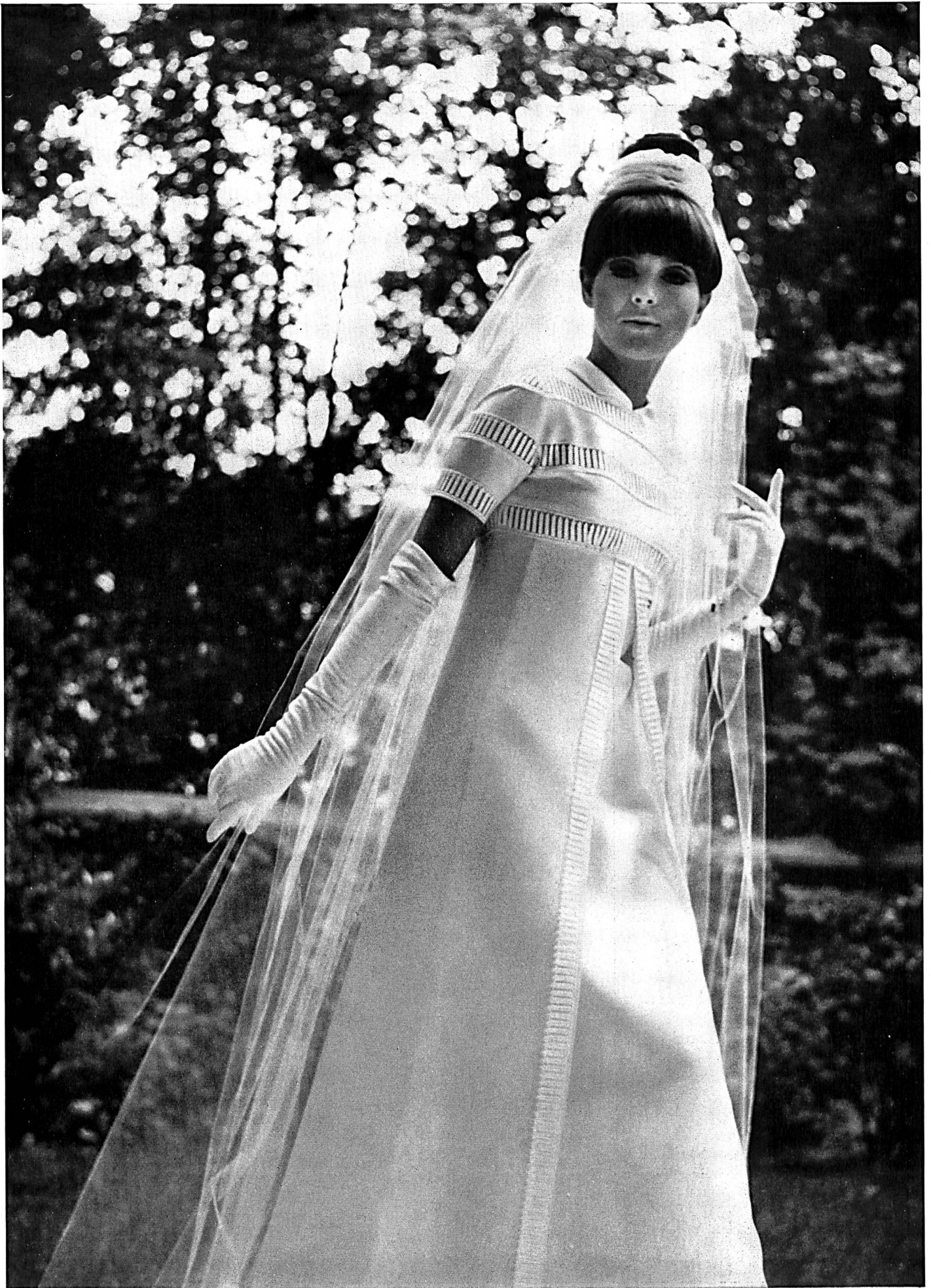
Carven Forster Willi & Co., Saint-Gall Bande de batiste brodée