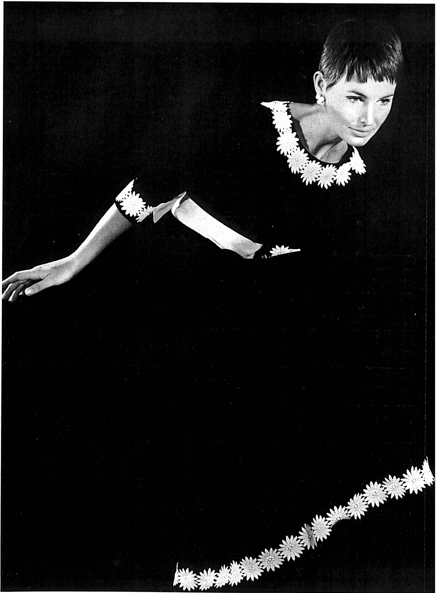
Yves Saint-Laurent Forster Willi & Co., Saint-Gall Galon de guipure