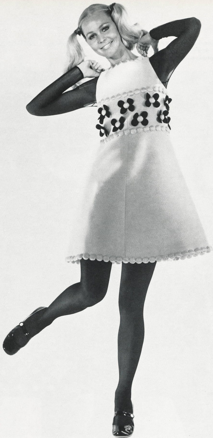
COURRÈGES Galons et fleurs de soie de A. Naef & Cie S. A., Flawil