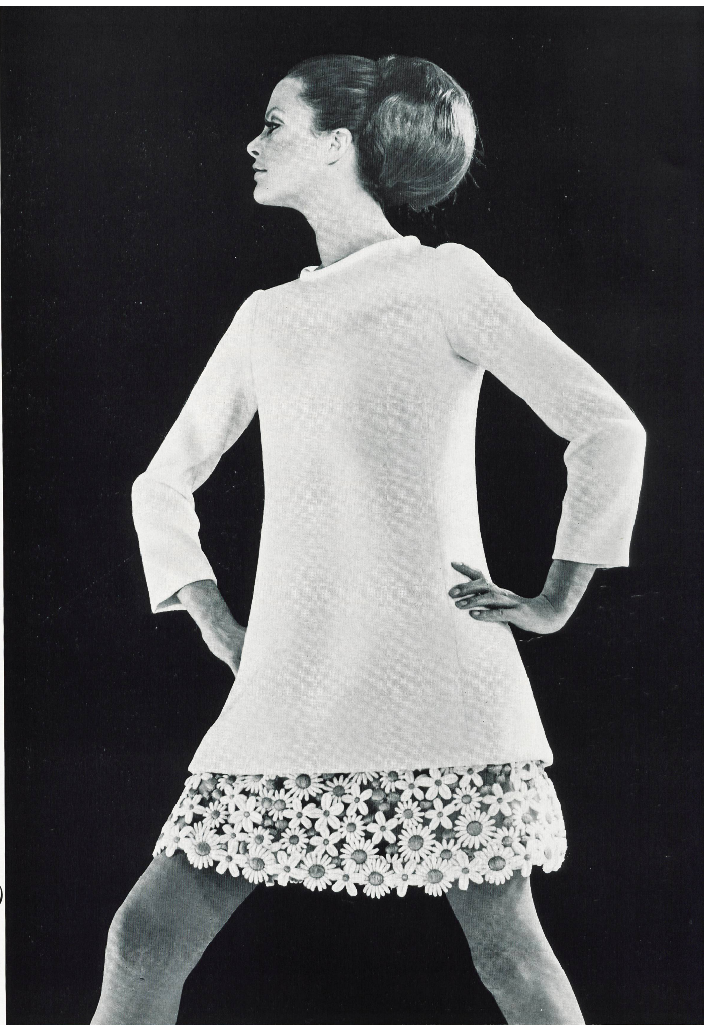
GUY LAROCHE Broderie de laine, avec fleurs superposées, de A. Naef & Cie S.A., Flawil Grossiste à Paris: Robert Burg S.A.