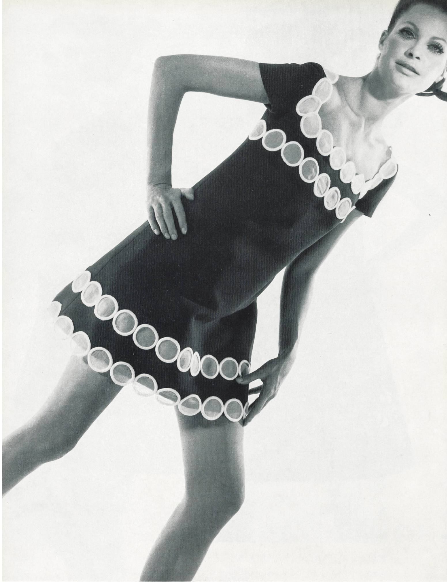
TORRENTE Galons brodés en laine sur organdi de J.G. Nef & Cie S.A., Herisau Grossiste à Paris: Robert Burg S.A.