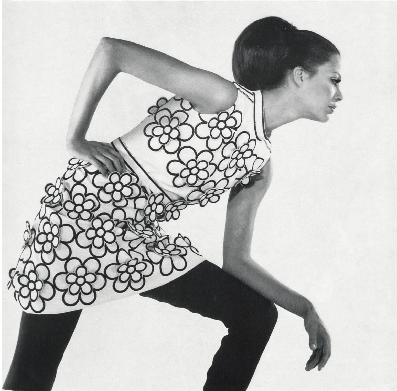
GUY LAROCHE Broderie de soie sur cuir artificiel, avec motifs superposés, de J.G. Nef & Cie S. A., Herisau Grossiste à Paris: Robert Burg S. A.