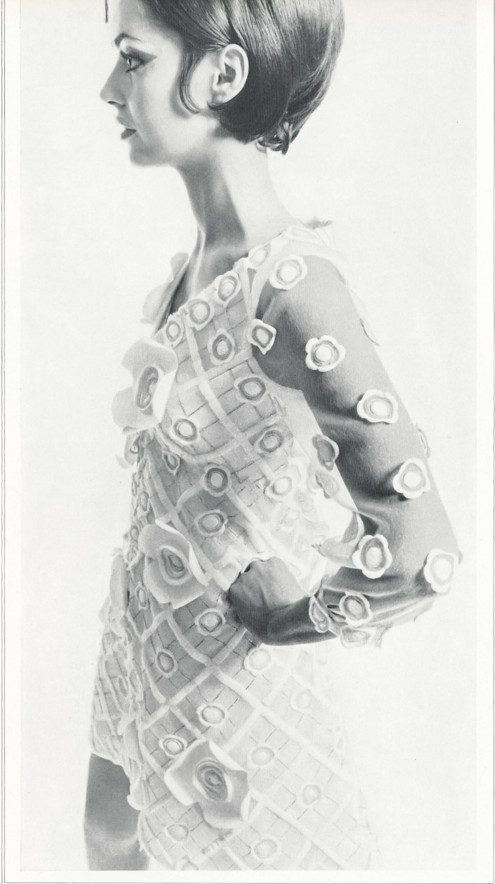
EMANUEL UNGARO Broderie de Walter Stark S.A., Saint-Gall