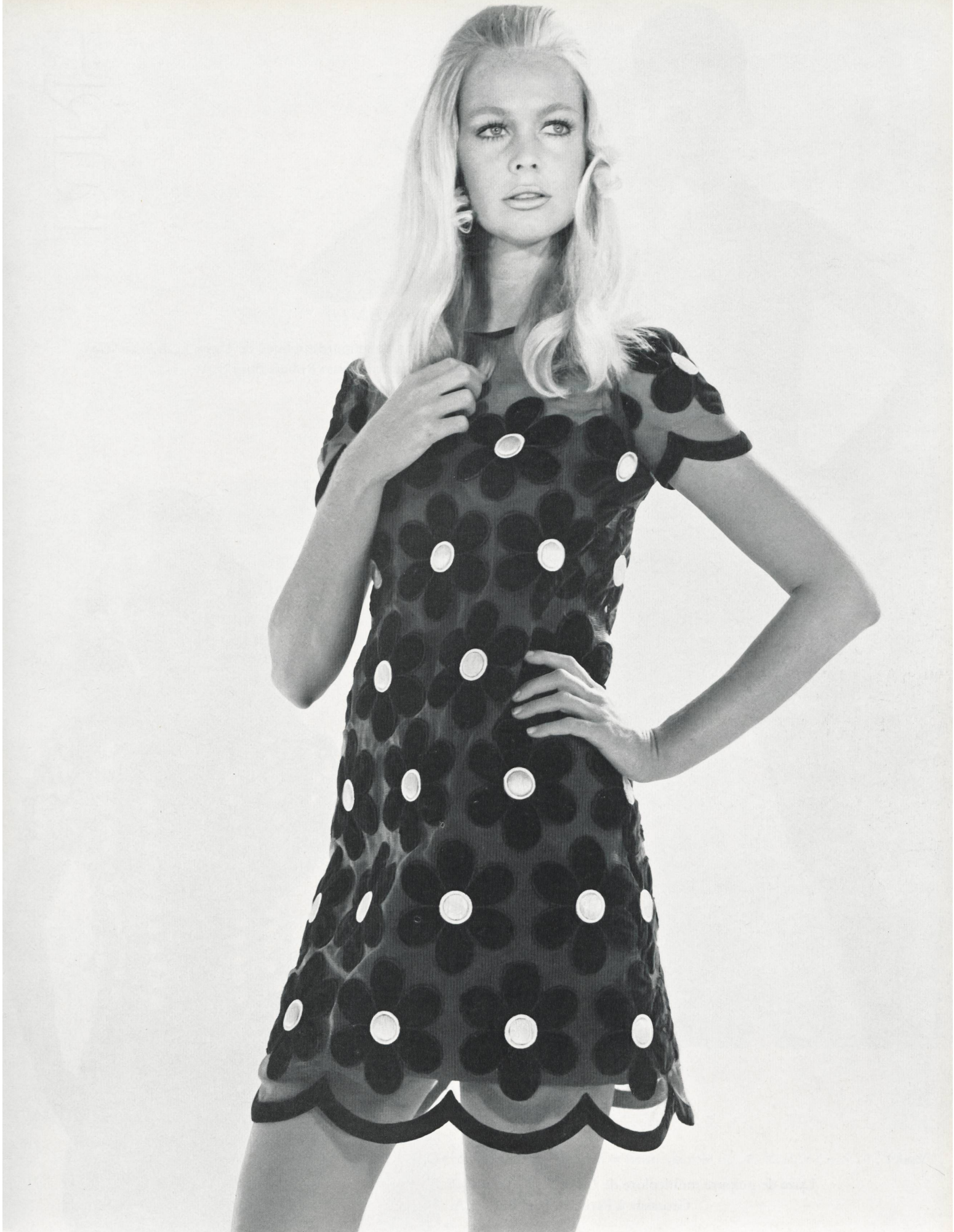
TORRENTE Applications de velours multicolores sur chiffonyl de Union S. A., Saint-Gall Grossiste à Paris: Robert Burg S. A.