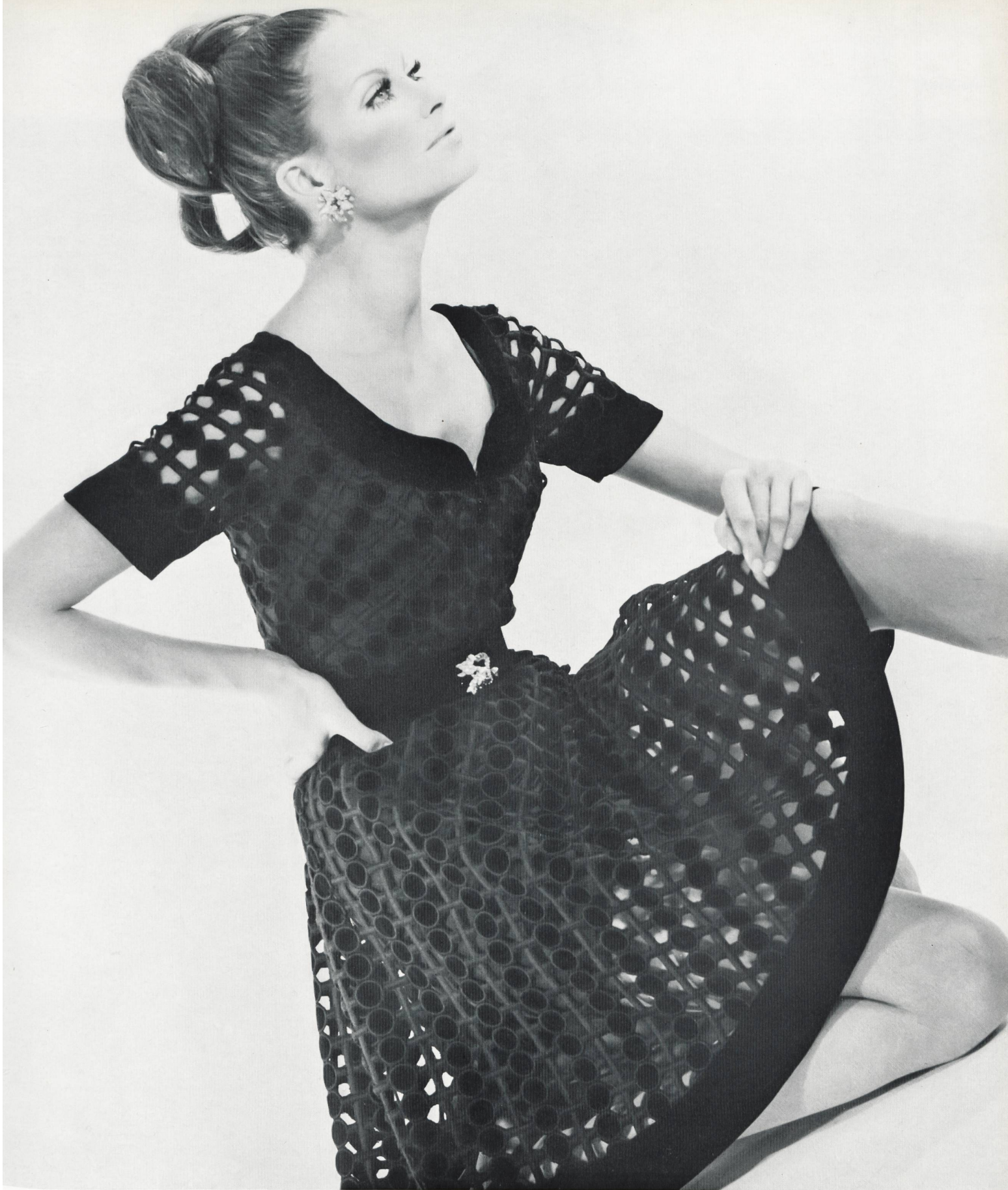
CARVEN Guipure en velours de couleur de Union S.A., Saint-Gall Grossiste à Paris: Robert Burg S.A.