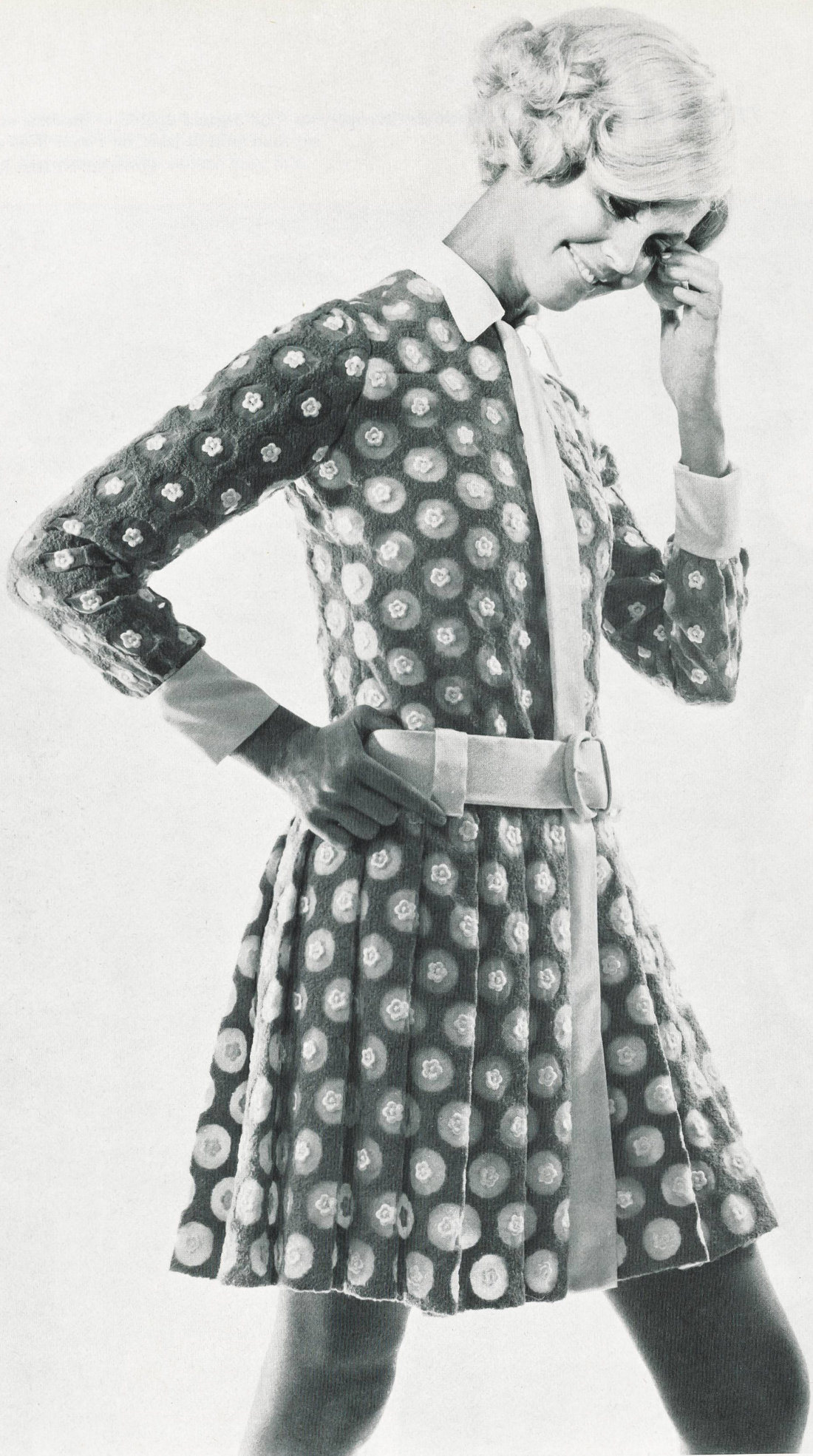
TED LAPIDUS Broderie de laine et de soie sur chiffonyl de Forster Willi & Cie, Saint-Gall Grossiste à Paris: Robert Burg S.A.