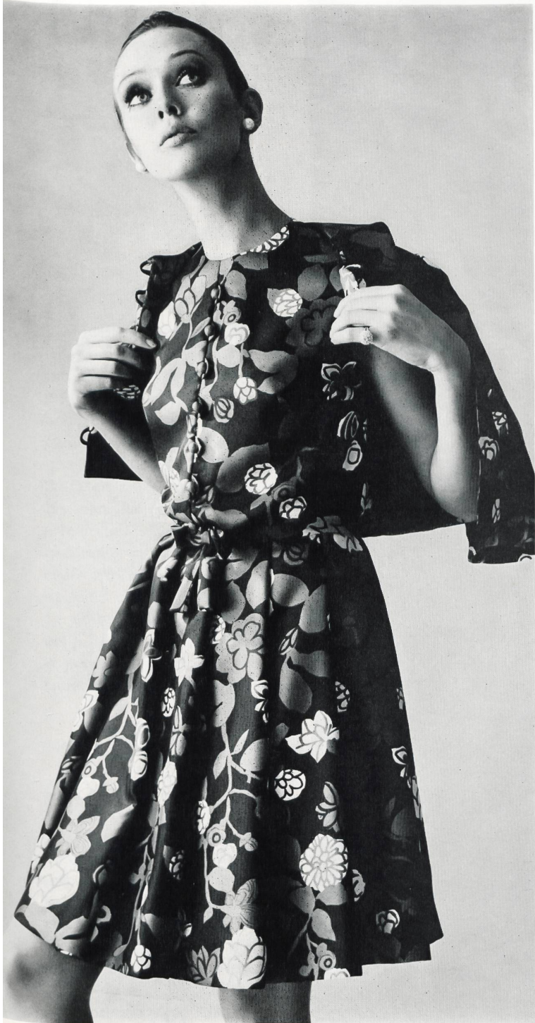
Reinseiden-Twill von GUT & CO. AG, ZÜRICH Modell: Cortesca AG, Zürich