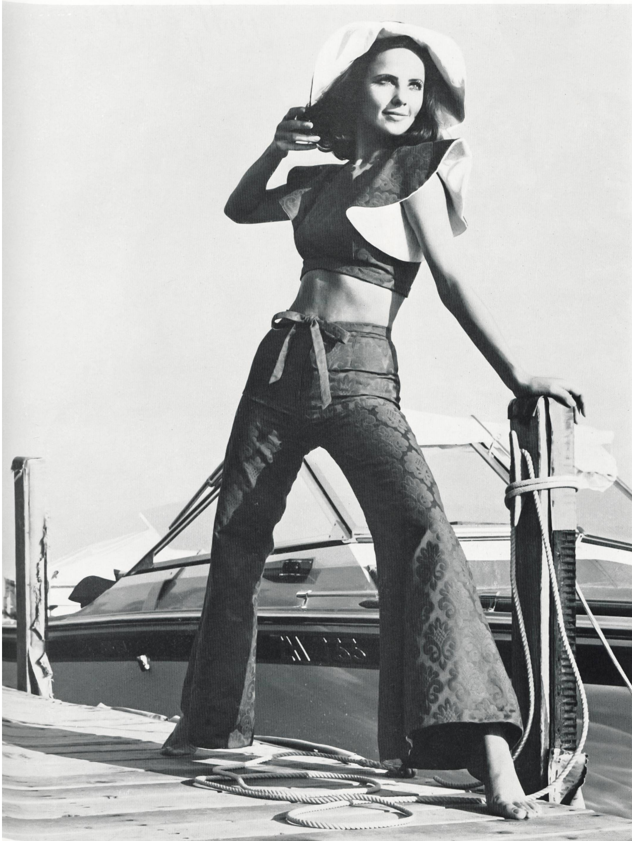
Baumwollpiqué Gobelin 1751 von METTLER & CO. AG, ST. GALLEN Modell: A. Blum & Co. AG, Zürich