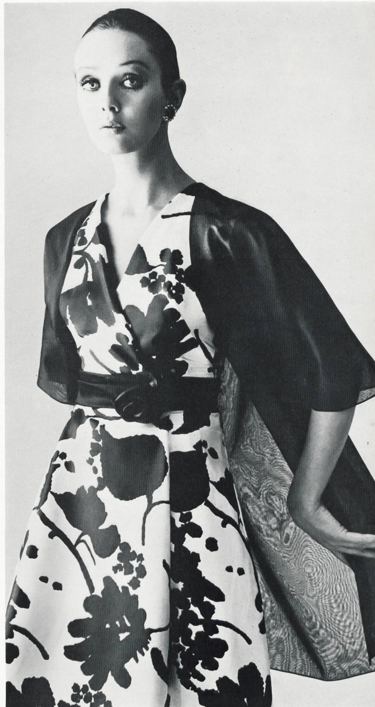
Reinseiden-Twill von HAUSAMMANN TEXTIL AG WINTERTHUR Modell: Cortesca AG, Zürich