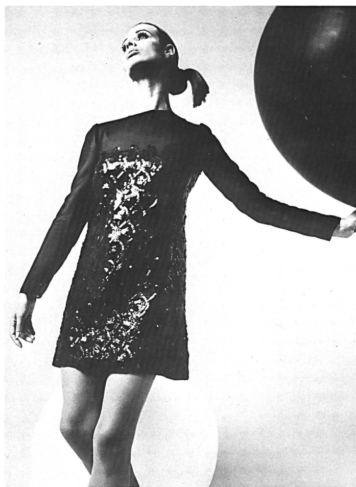
▲ CENTINARO, ROME Paillettes de JAKOB SCHLAEPFER & CIE S.A., SAINT-GALL