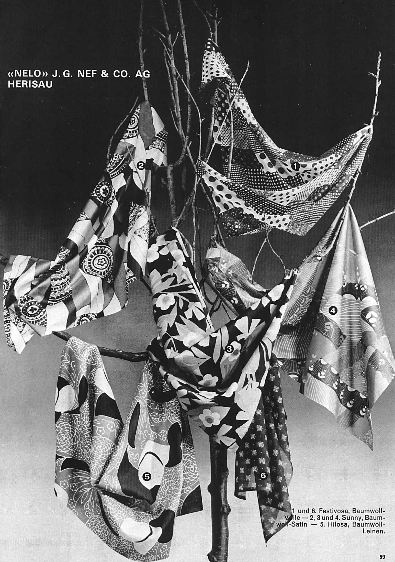
1 und 6. Festivosa, Baumwoll- Vile — 2, 3 und 4. Sunny, Baum- woll-Satin — 5. Hilosa, Baumwoll- Leinen.