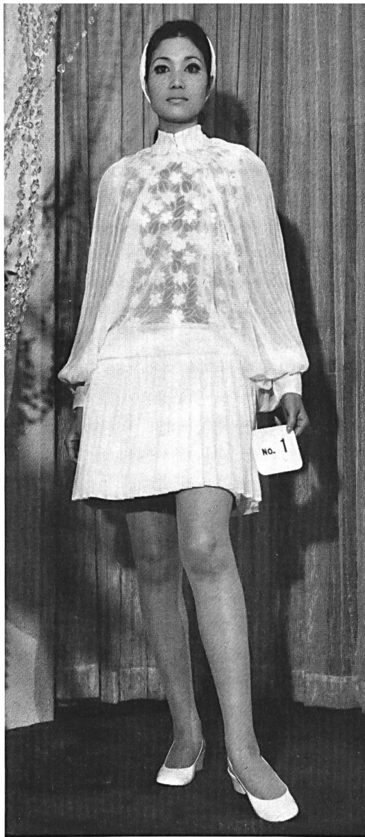
Embroidered silk organza by FORSTER WILLI & CO., ST-GALL