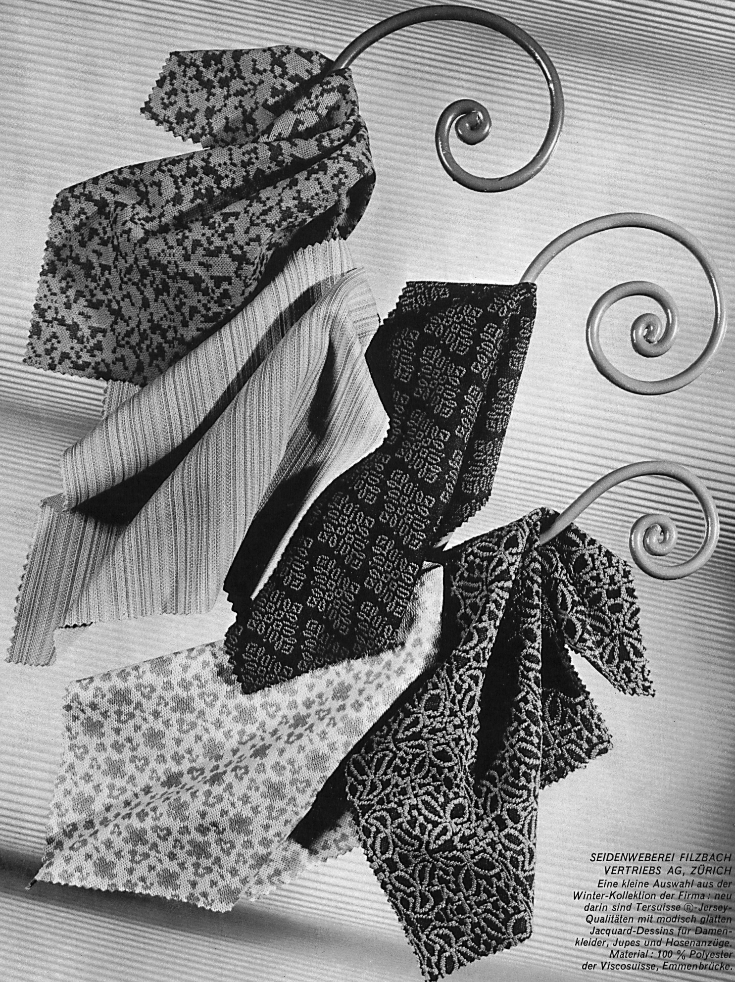
SEIDENWEBEREI FILZBACH VERTRIEBS AG, ZÜRICH Eine kleine Auswahl aus der Winter-Kollektion der Firma: neu darin sind Tersuisse®-Jersey- Qualitäten mit modisch glatten Jacquard-Dessins für Damen- kleider, Jupes und Hosenanzüge. Material: 100 % Polyester der Viscosuisse, Emmenbrücke.