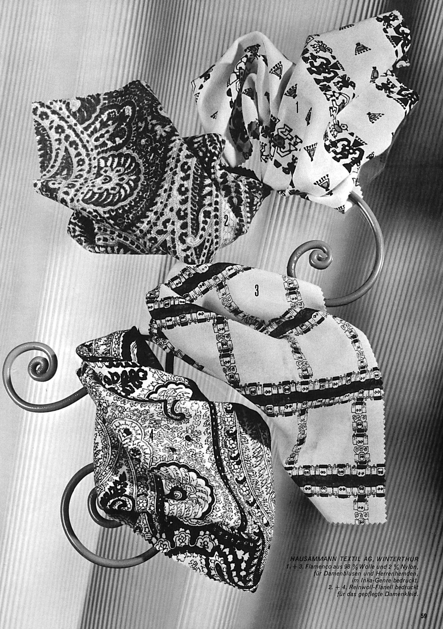
HAUSAMMANN TEXTIL AG, WINTERTHUR 1. + 3. Flamengo aus 98 % Wolle und 2 % Nylon, für Damenblusen und Herrenhemden, im Inka-Genre bedruckt. 2. + 4. Reinwoll-Flanell bedruckt für das gepflegte Damenkleid.