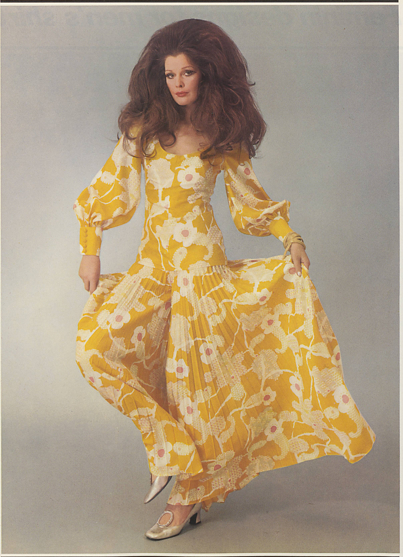
HAUSAMMANN TEXTILES LTD., WINTERTHUR Pure silk from the « osarob » collection Model: R. Cafader & Co., Zurich