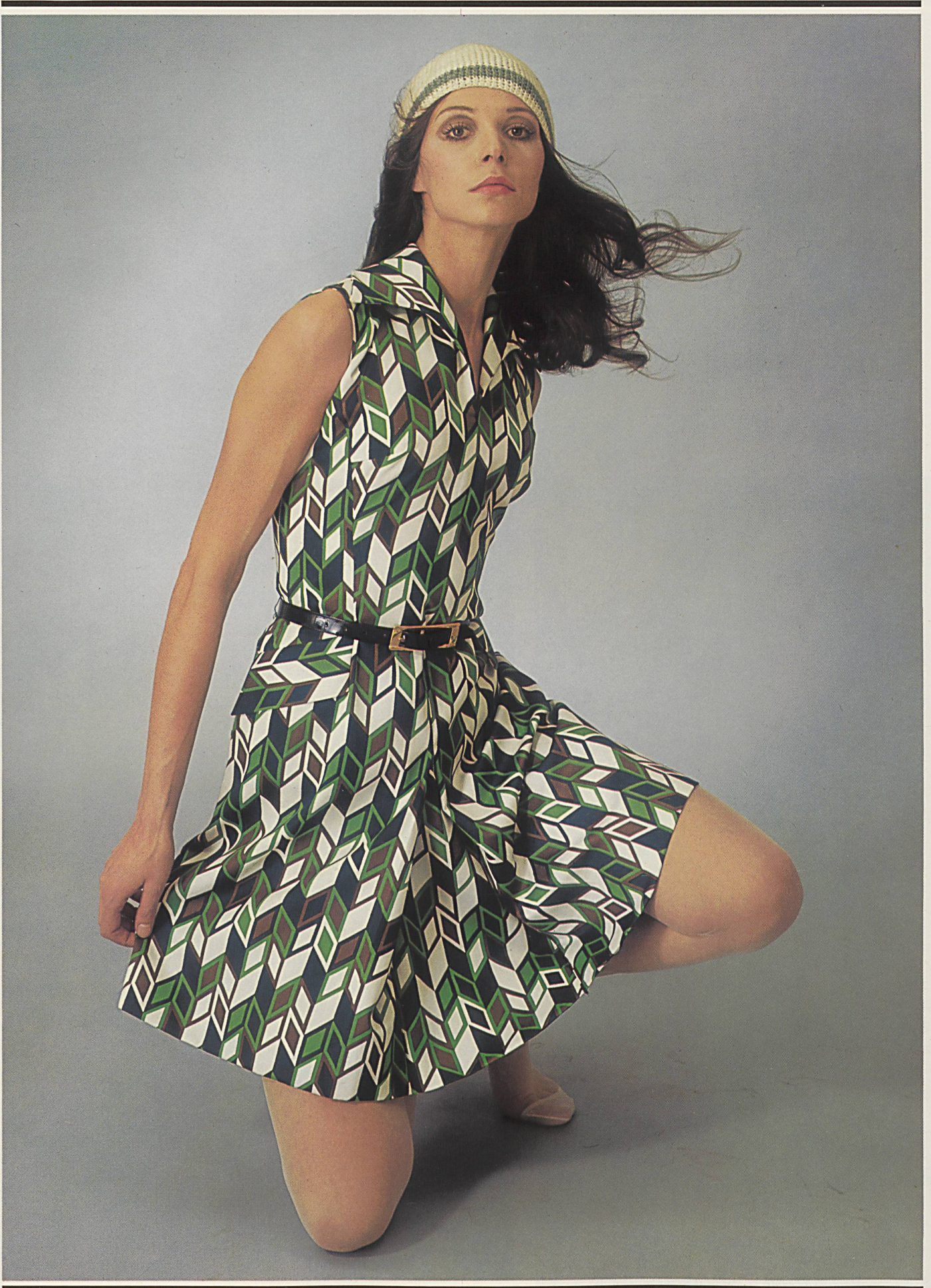
HAUSAMMANN TEXTILES LTD., WINTERTHUR Highly finished cotton print from the « osarob » collection Model: EL-EL Ltd., Zurich