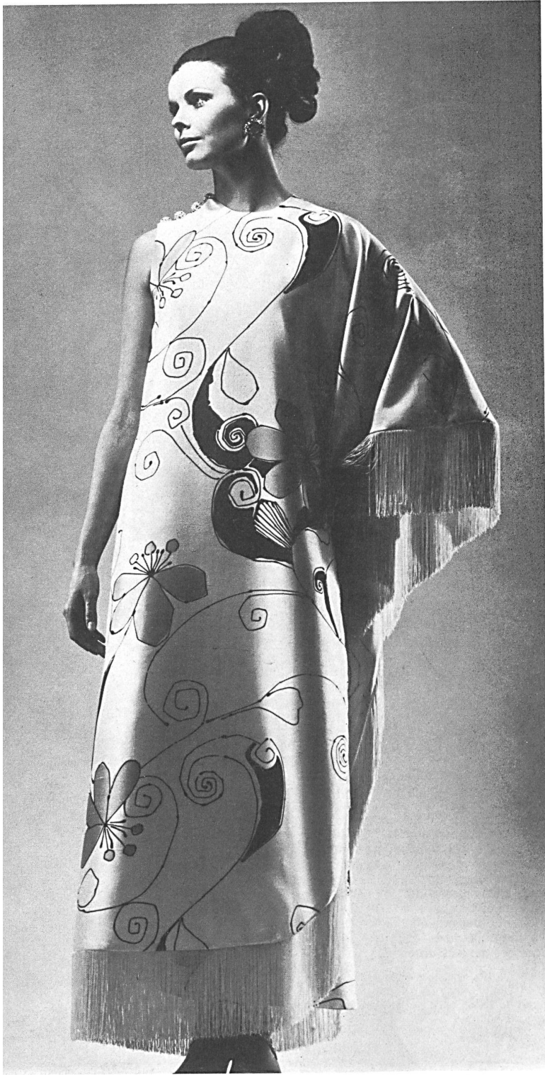
FISBA DE SAINT-GALL Shantung Gala en imprimé blanc et turquoise, avec franges blanches Modèle Toni Schiesser, Francfort