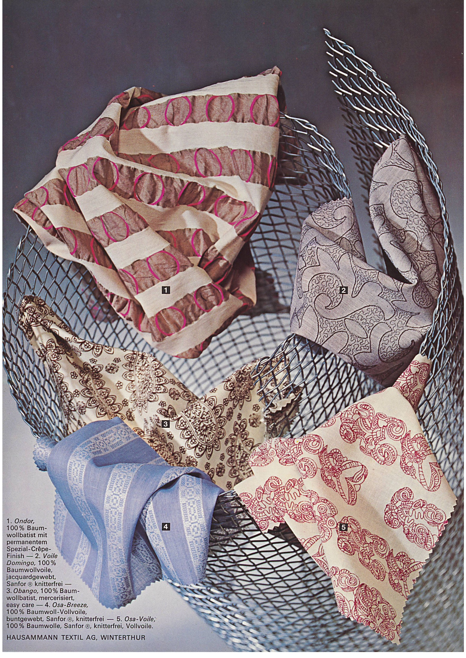
1. Ondor , 100% Baumwollbatist mit permanentem Spezial-Crêpe-Finish — 2. Voile Domingo , 100% Baumwollvoile, jacquardgewebt, Sanfor® knitterfrei — 3. Obango , 100% Baumwollbatist, mercerisiert, easy care — 4. Osa-Breeze , 100% Baumwoll-Vollvoile, buntgewebt, Sanfor®, knitterfrei — 5. Osa-Voile , 100% Baumwolle, Sanfor®, knitterfrei, Vollvoile.