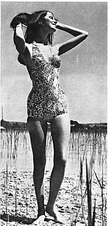
Pius Wieler Söhne AG, Kreuzlingen

Die Gliederung des schweizerischen Bekleidungsexportes nach Bestimmungsländern zeigt, dass sich die Ausfuhr nach den EWG-Ländern im Vergleich zum Vorjahr nicht verändert hat, während im EFTA-Raum eine Absatzsteigerung von 18,6 Mio. Fr. oder 29,4 % erzielt werden konnte. Der Export nach den überseeischen Staaten blieb mit einem Zuwachs von 14,1 % gegenüber dem ersten Semester 1969 etwas hinter den Erwartungen zurück. Auf Grund der Entwicklung der Bekleidungswarenausfuhr in der ersten Jahreshälfte 1970 lässt sich jedoch für das laufende Jahr ein neuer Exportrekord voraussagen.