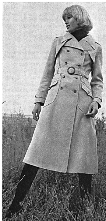
Croydor AG, Zürich