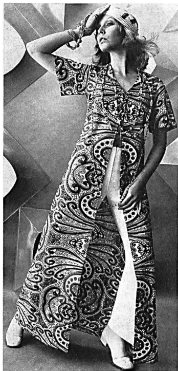
Spinnler & Co., Luzern