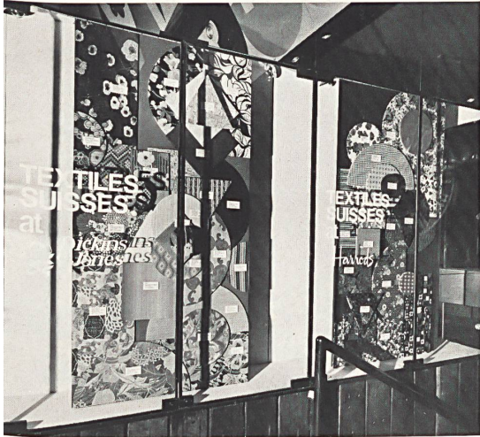
The striking display in the main show-case featuring fine Swiss fabrics from four well-known stores in London

Thousands of people, including many from abroad, visited the restaurants daily and showed considerable interest in the materials and fashion articles displayed there with details of their origin. In the main entrance to the restaurants were four very attractive montages of materials on four panels in toning colours featuring samples of fabrics from four leading London stores: Army and Navy Stores of Westminster, Dickins & Jones, Regent Street; Harrods,