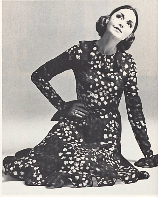
4. Frank Usher · Feminine long dress in border printed cotton voile by Taco Ltd., Glattbrugg