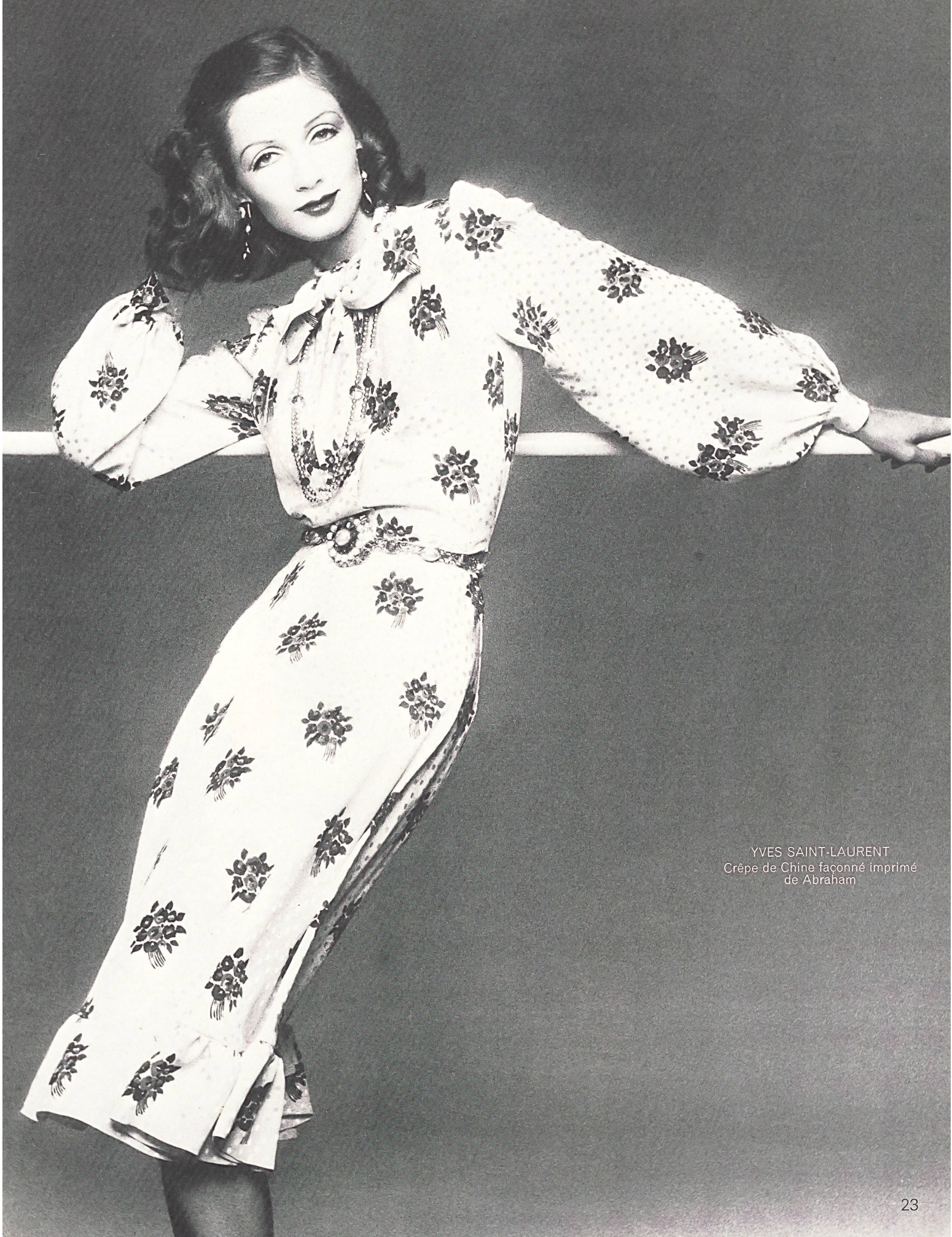
YVES SAINT-LAURENT Crêpe de Chine façonné imprimé de Abraham