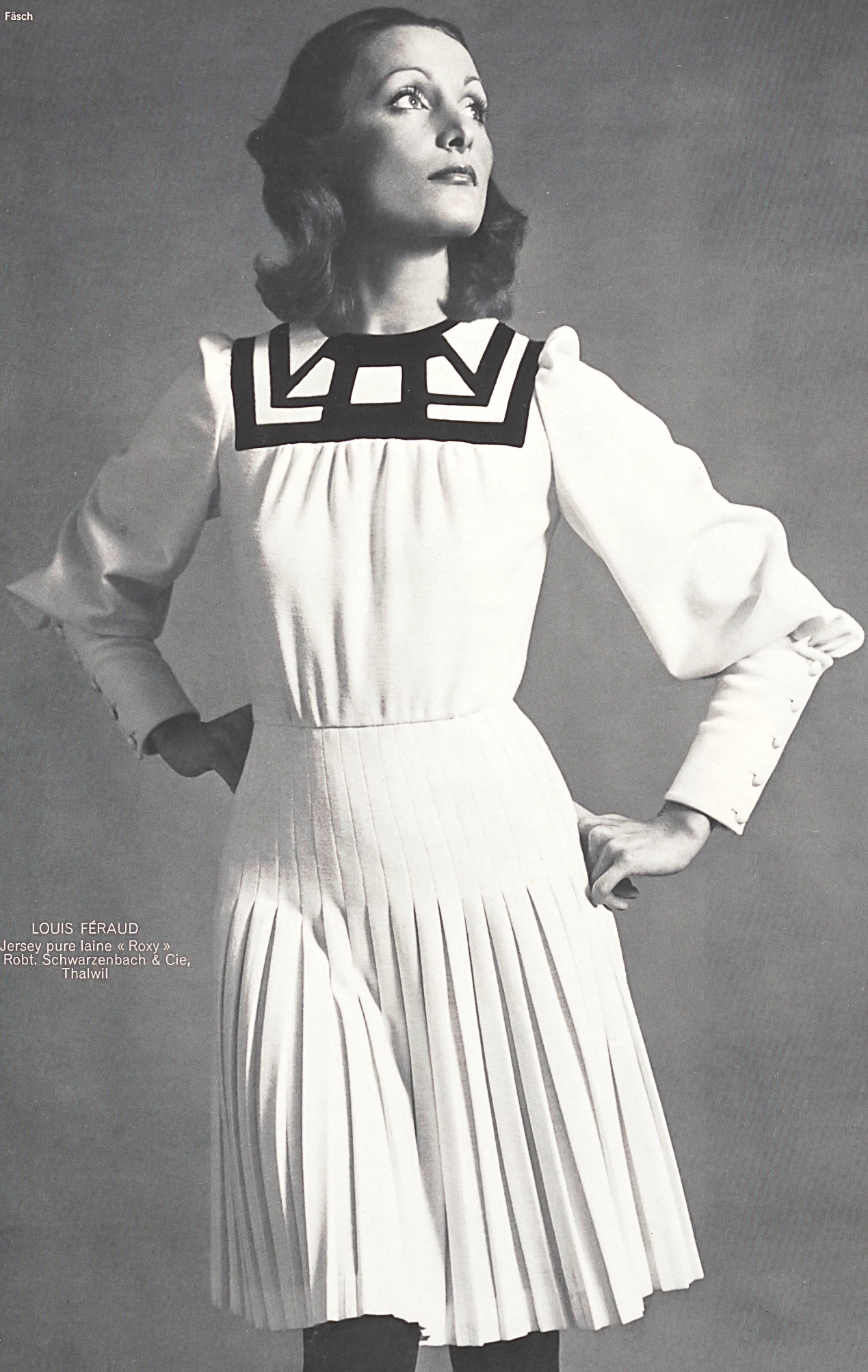
LOUIS FÉRAUD Jersey pure laine « Roxy » de Robt. Schwarzenbach & Cie, Thalwil