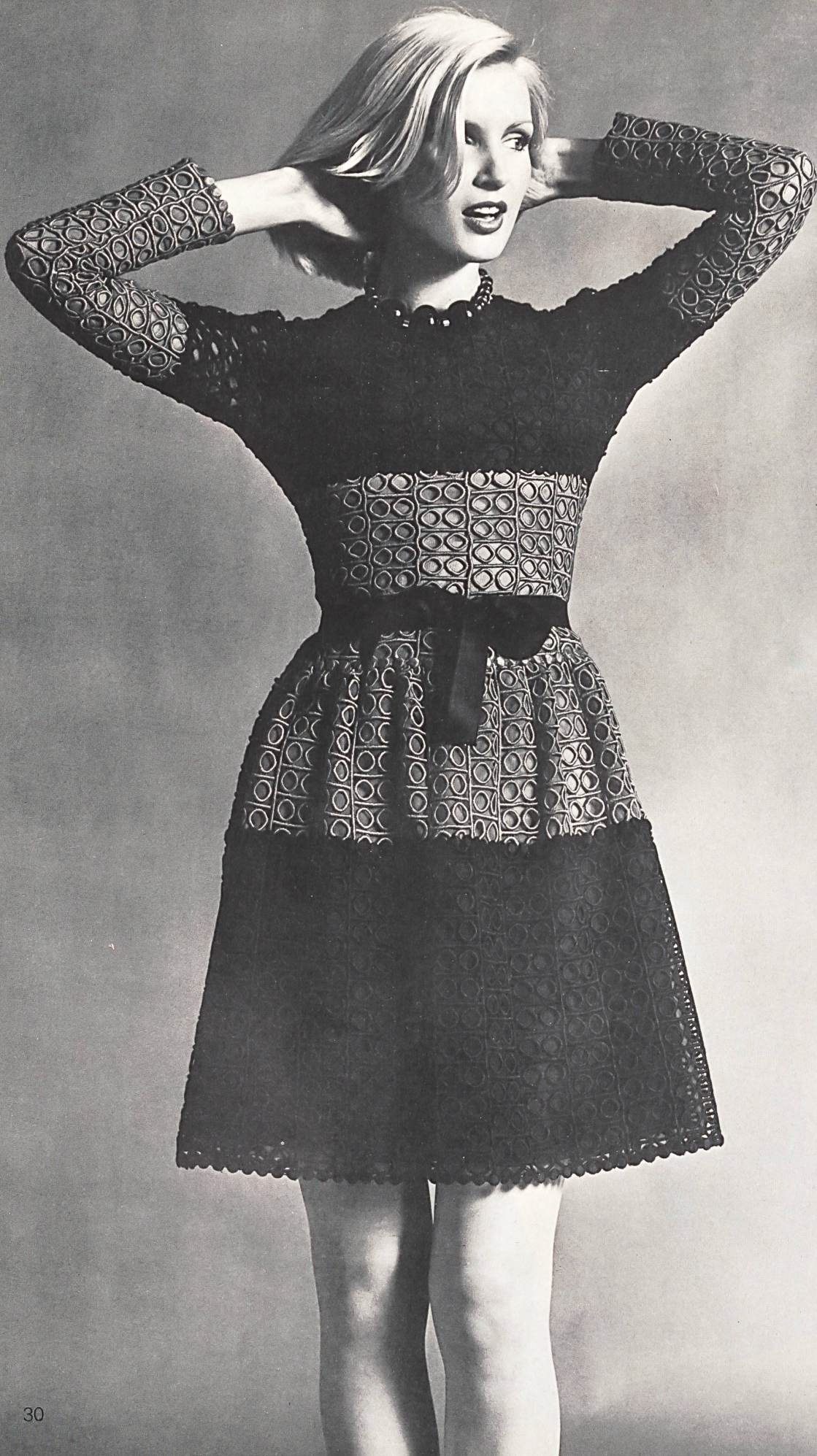
CHRISTIAN DIOR Laize de guipure en noir et rouge de A. Naef SA, Flawil