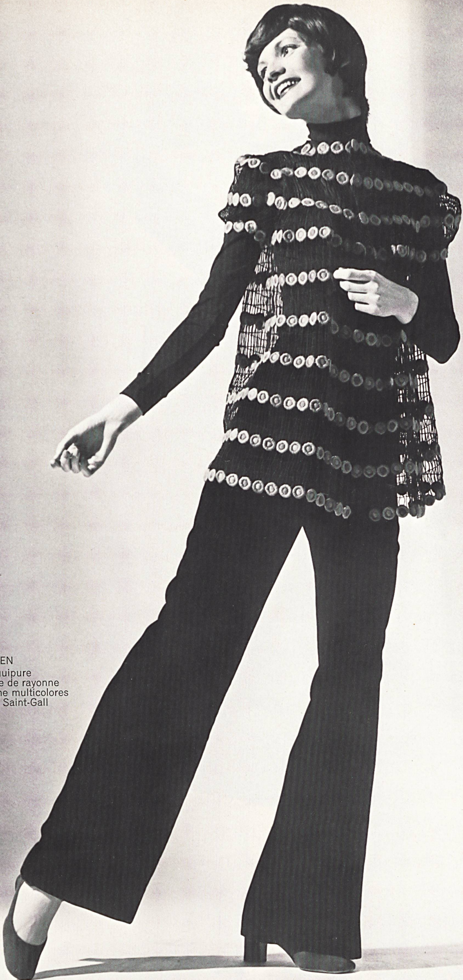
CARVEN Laize de guipure sur tissu grillage de rayonne avec fleurs de laine multicolores de Union SA, Saint-Gall