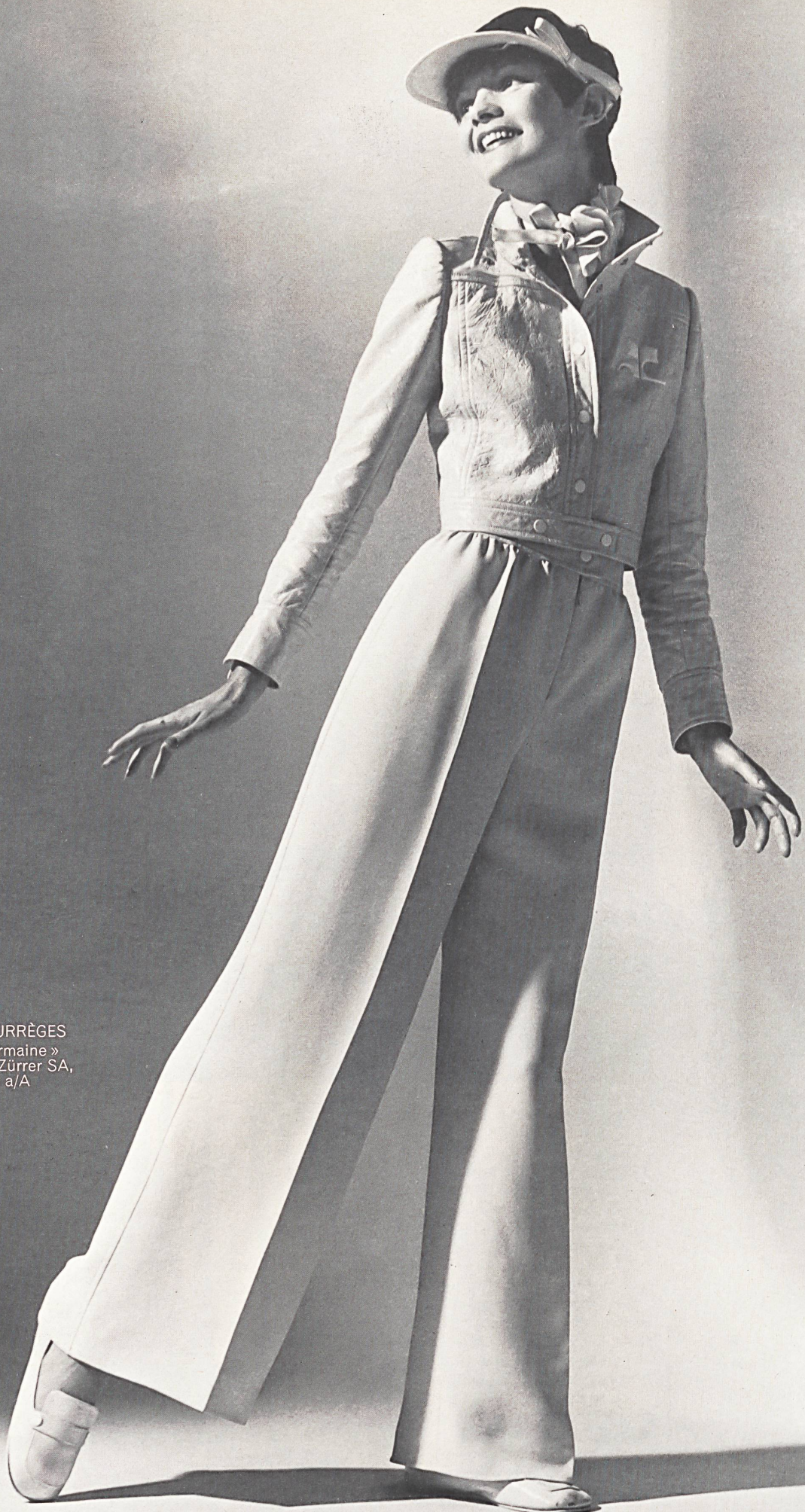
ANDRÉ COURRÈGES Crêpe « Germaine » de Weisbrod-Zürrer SA, Hausen a/A