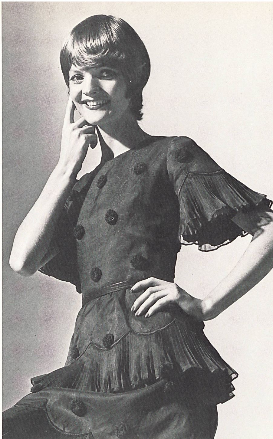
CARVEN Organza pure soie avec volants plissés et fleurettes de laine superposées de Union SA, Saint-Gall

ten, die oft bis zur Gürtellinie reichen, an nackten Rücken, die durch flatternde Volants kokette Bedeckung erhalten. Feinste, transparente Gewebe unterstreichen das Duftige, Fliessende solcher Gewänder. Dazu bringen die bunten Tupfen, mit denen diese im Flou-Stil gehaltenen Kleider überstickt sind, eine jugendlich aktuelle Note. Tupfen sind es, die auch als Bordürendessin reizvoll zur Geltung kommen.