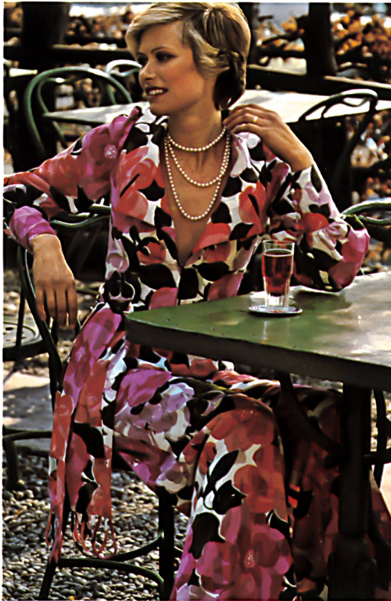
► Jacquard de coton à fils coupés, imprimé. Bedruckter Baumwoll-Jacquard mit Scherli. Printed cotton jacquard with clipcords.

Christian Fischbacher Co., St-Gall, présente, pour la saison printemps/été 1974, une collection spécifiquement mode, convenant aussi bien pour le prêt-à-porter que pour les détails de la confection de genre élevé et répondant aux goûts des femmes jeunes ou qui le sont restées.