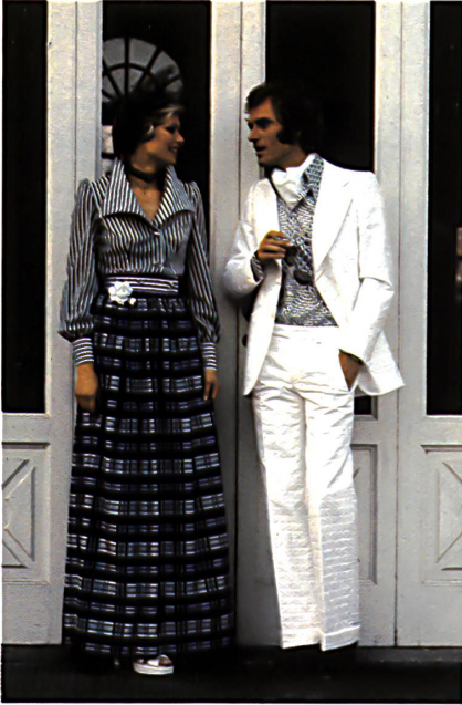
▲ Blouse en voile de coton imprimé à rayures « Tamara », jupe en voile à carreaux satin « Carlita ». Complet masculin en jacquard de coton « Riviera », chemise en satin de coton imprimé « Linda ». Bluse aus gestreift bedrucktem Baumwoll-Voile « Tamara », Rock aus Voile mit Satin-Karos « Carlita ». Herren-Anzug aus Baumwoll-Jacquard « Riviera », Herrenhemd aus Baumwoll-satin « Linda » bedruckt. Blouse in striped "Tamara" cotton voile print, skirt in "Carlita" voile with satin checks. Men's suit in "Riviera" cotton jacquard, men's shirt in "Linda" cotton satin print.