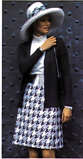
Blouse en jersey de coton uni « Venusia », jupe en jacquard « Palazzo » à dessin pied-de-coq. Bluse aus Baumwoll-Jersey « Venusia » uni, Rock aus Jacquard « Palazzo » mit Hahnentritt-Dessin. Blouse in plain "Venusia" cotton jersey, skirt in "Palazzo" jacquard with houndstooth check.