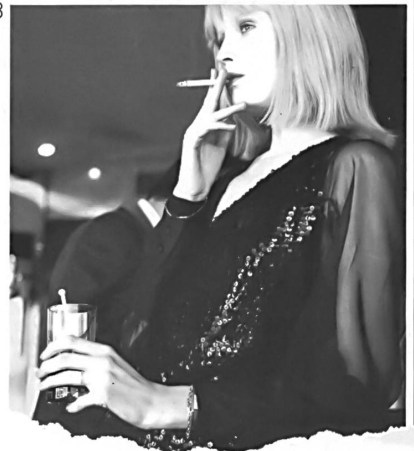
1 MISS DIOR, PARIS 2 ACMÉ, NICE 3 G. KAZAZIAN, PARIS 4 PHILIPPE VENET, PARIS 5 J. TIKTINER, NICE 6 G. KAZAZIAN, PARIS 7 MARIELLA AMI, RÔME TISSUS JAKOB SCHLAEPPER. PHOTOS PETER KOPP