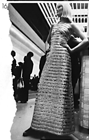
15 GITS, PARIS 16 DAVID MOLHO, PARIS 17 PAULETTE BURAUD, PARIS 18 TRÉVISE COUTURE, PARIS 19 DAVID MOLHO, PARIS 20 GITS, PARIS TISSUS JAKOB SCHLAEPPER.