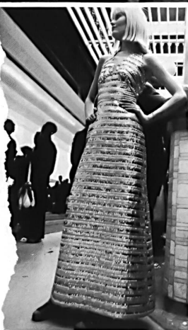
15 GITS, PARIS 16 DAVID MOLHO, PARIS 17 PAULETTE BURAUD, PARIS 18 TRÉVISE COUTURE, PARIS 19 DAVID MOLHO, PARIS 20 GITS, PARIS TISSUS JAKOB SCHLAEFFER.