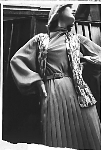
34 GIVENCHY NOUVELLE BOUTIQUE, PARIS 35 GIVENCHY NOUVELLE BOUTIQUE, PARIS 36 GIVENCHY NOUVELLE BOUTIQUE, PARIS TISSUS JAKOB SCHLAEPFER. PHOTOS PETER KOPP 37 GUY LAROCHE, PARIS 38 GUY LAROCHE, PARIS