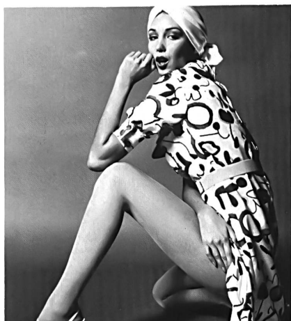
ROBT. SCHWARZENBACH & CO. AG, THALWIL Kleid aus bedrucktem « Mongol »-Shantung, reine Seide. Robe en shantung « Mongol » pure soie, imprimé. Dress in printed "Mongol" shantung, pure silk. Modell/Modèle/Model: Carven, Paris

Les soieries véritables et simili, avec leur éclat adouci, leur tomber souple et leur toucher agréable figurent aujourd'hui au centre de l'intérêt en matière de mode. Le style chemisier, les jupes cloches, les jupes à plis et plissées appellent ces tissus; mais beaucoup de longues et vaporeuses robes du soir également, sont inimaginables sans les crêpes fluides, les georgettes délicats ou les transparentes mousselines, les chiffons et les organzas. La soie véritable, bien sûr, est toujours ce que l'on peut se figurer de plus noble, mais comme cette fibre ne peut plus être obtenue en quantités suffisantes et que son prix augmente continuellement, l'industrie textile est obligée d'avoir recours à des mélanges avec diverses fibres synthétiques ou à l'emploi de fibres chimiques seules. La texturation des filaments et autres procédés permettent, si les matières sont judicieusement choisies, d'obtenir une ressemblance vraiment très rapprochée avec le produit original. C'est pourquoi la haute couture, le prêt-à-porter et la confection peuvent aujourd'hui choisir les plus belles impressions de style soie dans les collections actuelles pour en créer des modèles d'une élégance féminine raffinée, même si la matière de base n'est pas tirée de cocons.