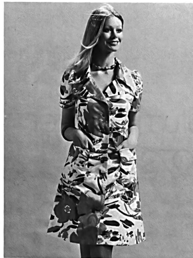
HAUSAMMANN TEXTIL AG WINTERTHUR

Deux-pièces en pur coton à frais dessin géométrique, porté avec une blouse en voile de coton uni.