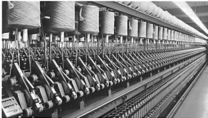
Rieter Ringspinnmaschinen Rieter ring-spinning machines

Die Kollektion bei Berger AG ist gross und vielseitig. Der ehemalige Uni-Spezialist bietet heute rund 500 Dessins und Farben in allen drei Qualitäten an. Die Dessinierung ist zwar modisch orientiert, doch vermeidet man schwer verkäufliche Extravaganzen. In der Farbpalette berücksichtigt man die herrschenden Tendenzen stets unter Beibehaltung einer Kollektion in den klassischen Blau-, Grau-, Beige- und Brauntönen. So ist die Firma auf die Herstellung von anspruchsvollen HAKA-Stoffen spezialisiert und schenkt dem betont modischen Sortiment, das sich seit Jahresfrist verdreifacht hat, besonders grosse Beachtung.