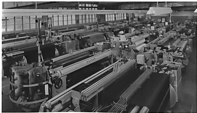
Sulzer-Weberei Sulzer looms