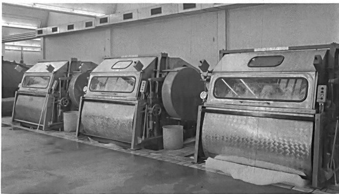
Moderne Schnellwäscher Modern rapid washing machines