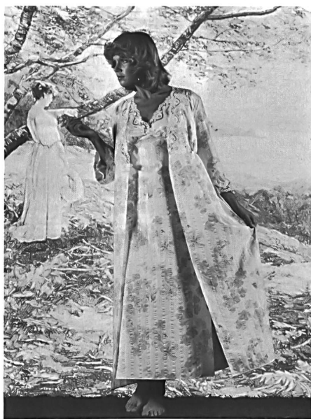
BAERLOCHER & CO. AG, RHEINECK Chemise de nuit avec saut-de-lit en Tutorette® pur coton, à repassage superflu, en bleu clair uni. — Uni hellblaues Nachthemd mit Negligé in Tutorette® aus 100 % Baumwolle, bügelfrei. — Pale blue nightdress with negligé in pure cotton non-iron Tutorette®.

(Modèles/Modelle/Models: International Monarch, Biancheria d'Arte)