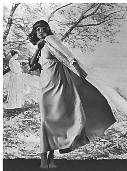
BAERLOCHER & CO. AG, RHEINECK Jolie chemise de nuit avec saut-de-lit en Tutorette® pur coton à repassage superflu, imprimé en turquoise et blanc. — Hübsches Nachthemd mit Negligé in Tutorette®, weiss/türkis bedruckt aus 100 % Baumwolle, bügelfrei. — Alluring nightdress and negligé in Tutorette®, white/ turquoise pure cotton non-iron print.

(Modèles/Modelle/Models: Mylady AG, Rheineck)