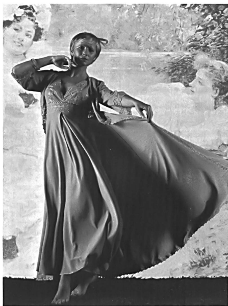
UNION AG, ST. GALLEN Séduisant saut-de-lit porté sur une chemise de nuit longue, sans manches, en crêpe de nylon turquoise. — Verführerisches Negligé mit Canotte in Türkisblau aus Nylon Crêpe. — Seductive nightgown and negligé in turquoise blue nylon crêpe.

possible, providing them with a wide variety of permanent finishes and decorating them with romantic floral prints. They have also mixed cotton fibres with synthetics or used chemical fibre fabrics and jerseys to create articles that require no ironing. The choice of fabrics for fashionable night attire is extraordinarily rich, as also the selection of embroidery trimmings offered by the Swiss embroidery industry, so that nightdress manufacturers have practically unlimited sources from which to draw their inspiration. The embroidery grounds are subject to the same conditions as the fabrics and are therefore also easy-care. Embroidery edgings, broderie anglaise, floral motifs embroidered in the form of allovers, bands and braids of various widths, embroidered flounces and single embroidery motifs are but a few of the specialities renewed every year to satisfy the current trends. Mention should also be made of embroideries combined with prints, for which broderie anglaise is a top favourite.