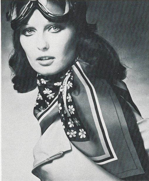
ABRAHAM AG, ZÜRICH

devant ou sur la nuque, enveloppant la tête en fanchon, en marmotte ou en turban, les carrés et écharpes se prêtent à tous les effets. Ce qu'on voit le plus, ce sont les imprimés floraux stylisés, les pois, les rayures et les quadrillages. Ils soulignent les tendances des dessins de tissus et sont des compagnons si complaisants qu'aucune femme ne voudrait se passer d'avoir tout un assortiment de ces ravissants colifichets, que les fabricants suisses produisent souvent pour le compte de couturiers.