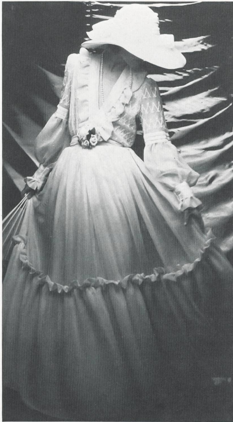
1. Kunstseiden-Guipure in Beige, Caramel, Lila, Smaragdgrün und Rost / guipure de rayonne beige, caramel, lilas, émeraude et rouille / beige, caramel, lilac, emerald and rust rayon guipure.