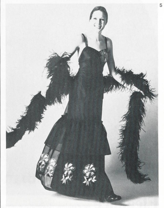
Ensemble mit dreifarbiger Stickerei in originellem Blumenmuster (weiss-grün-shockingrosa) / outfit with original floral design in three-toned embroidery (white-green-shocking pink).