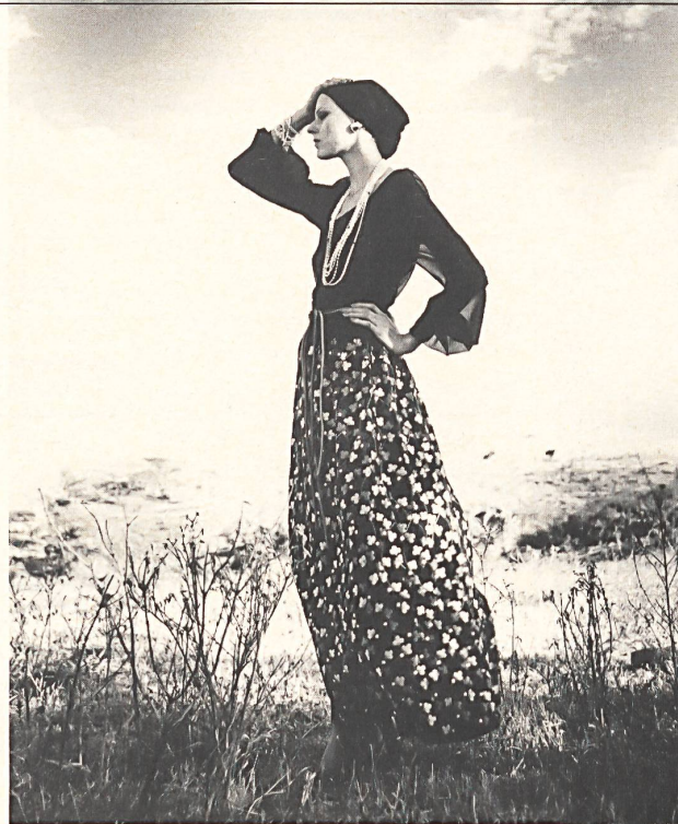
Long skirt in multi-coloured embroidery on black ground by Union Co. Ltd., St. Gall