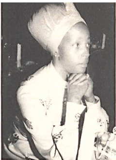
Blouse and skirt in cotton voile and piqué print by Christian Fischbacher Co. Ltd., St. Gall