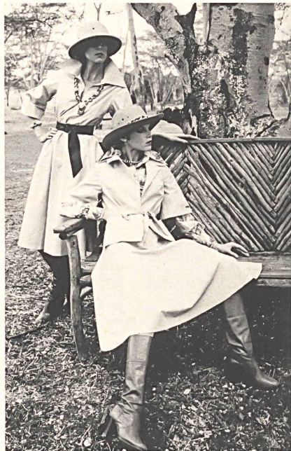
Modern safari-look dress and two-piece outfit in cotton/Dacron® poplin by Stoffel Co. Ltd., St. Gall