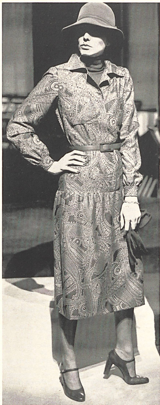
1 Robe chemise en tissu soie et laine imprimé. Chemisekleid aus bedrucktem Seiden/Woll-Gewebe. Shirt dress in silk/wool print.

Pure silk is the password to the loveliest and most fashionable fabrics used by Haute Couture in its latest collections. Not only do the crêpes from Abraham, Zurich — crêpe georgette, crêpe de