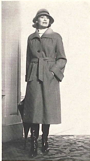
Topmodischer Mantel aus genoppter Shetlandwolle IWS. (René Schaad)