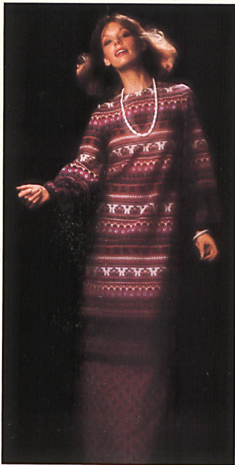
Δ Casaque in printed wool mousseline «Olivia». / Kasack aus bedruckter Wollmousseline «Amanda». / Casaque en mousseline de laine «Amanda» imprimée.

passende Allovers als ideale Composés kreiert worden sind. Eingefärbte Fonds wie Tabak, Rose, Türkis, Cadmiumgelb, Lavendel und ein weiches Beige spielen in der harmonischen Farbskala eine wichtige Rolle. Ein paar Einhänder-Dessins komplettieren das straffgehaltene Sortiment, das ein Musterbeispiel für eine erfolgreiche, gut überblickbare DOB-Kollektion ist, die vor allem die Kleiderfabrikanten anspricht.