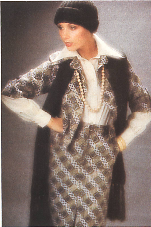
Two-piece outfit in printed wool mousseline «Olivia». Blouse in plain cotton voile. / Deux-pièces aus bedruckter Wollmousseline «Olivia». Bluse aus uni Baumwollvoile. / Deux-pièces en mousseline de laine «Olivia» imprimée. Blouse en voile de coton uni.