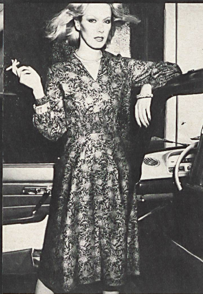
Δ Δ Ensemble en pur coton « Sabrina » mercerisé, de METTLER + CIE SA, SAINT-GALL.