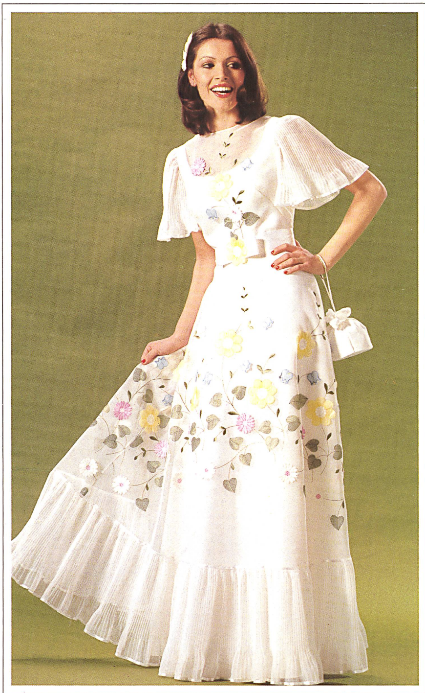
NELO J. G. NEF + CO. AG, HERISAU Multicoloured embroidery / Mehrfarbige Stickerei / Broderie multicolore.

légèrement structuré. La matière, soie, mélanges ou synthétiques, dépend de la classe de prix des modèles.