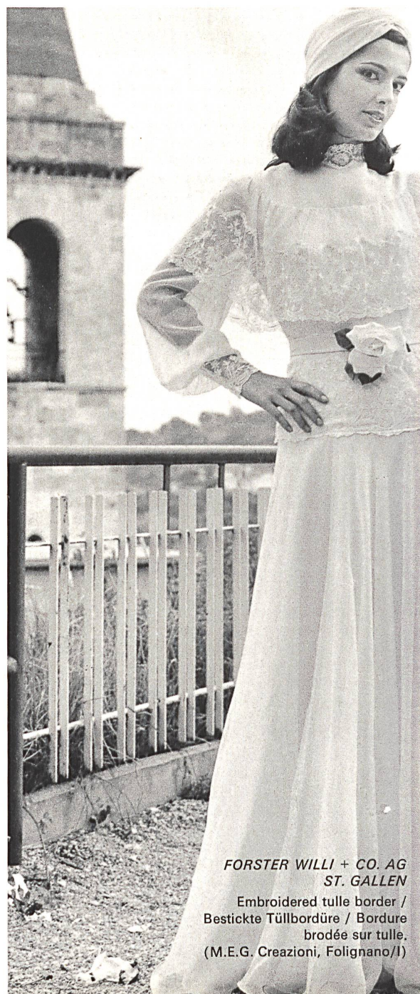
FORSTER WILLI + CO. AG ST. GALLEN

à la beauté du tissu et à la perfection de la façon. Broderie et dentelles sont toujours les éléments principaux dans la réalisation d'une romantique robe de noces. Les matières les plus utilisées sont la gracieuse guipure, la broderie artistement découpée, les bordures brodées avec incrustations de tulle et applications florales en blanc ou en coloris légers, les laizes brodées, souvent avec des bouquets isolés entourés de beaucoup de fond uni. Les tissus sont principalement le chiffon, l'organzin, l'organza, le satin organza et l'organdi, qui constituent aussi le fond des broderies. On aime également les divers types de crêpe et nouvellement même un jersey