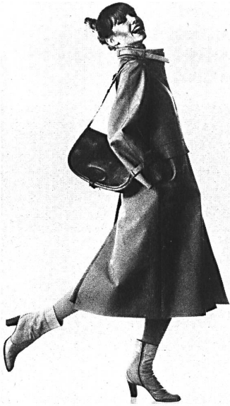
Stiefeletten aus Leinwand, mit Naturleder kombiniert (Bally Boutique).

Bei einer Pressekonferenz in Zürich stellten die Bally Schuhfabriken AG, Schönenwerd, die neuen Modelle für 1977 vor, kombiniert mit sportlich eleganten Mänteln, Ensembles und Kleidern, ebenfalls zum Bally-Verkaufsprogramm gehörend. Eine ganze Reihe von Schuhen geht in die sportliche Richtung wie die Trotteur-Espadrilles aus kräftigem Naturleder oder Stoff, mit mittelhohem Keilabsatz. Ganz flach gibt sich eine aus Briden bestehende Sandale oder der Ballerina, mit und ohne Knöchelbriden, auch in Gold und Silber. Halbhohe Stiefeletten aus Leinwand, mit Leder kombiniert, gehören mit ins sportliche Sortiment.