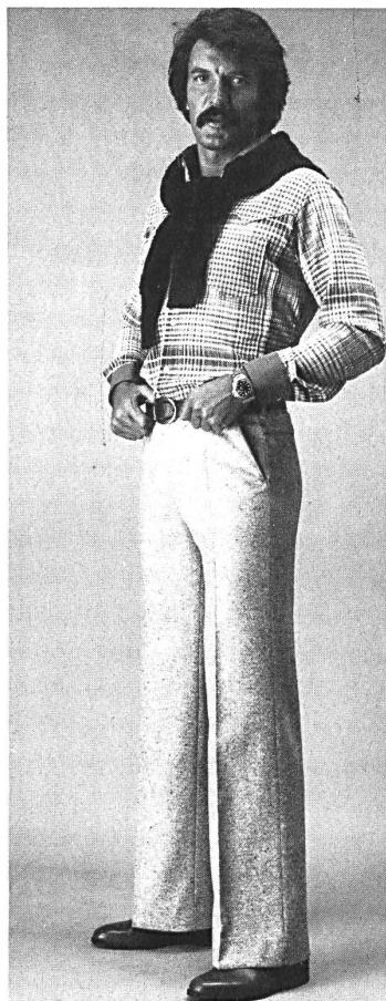
Einzelhose mit Kontrast-Passepoil an Taschen und Sattel, Valerino®-Programm.

«Jack's statt Jeans»... unter diesem Motto stellt die Firma Ritex AG erstmals ein vielfältiges «Leisure wear»-Winterprogramm vor und bietet damit dem Herrn über 30 einen Freizeit-Look, der als eine echte Alternative zur Jeanbekleidung angesehen werden darf. Die sportlich akzentuierten Details geben dem nonchalanten Stil die besondere Note. Eine weitere Neuerung ist das dem heutigen Geschmack angepasste Ritex-Signet mit dem Zusatz for men und der nachfolgenden Erklärung Tailored in Switzerland , wodurch man eindeutig orientiert wird, dass Ritex-Produkte vollständig in der Schweiz hergestellt werden.