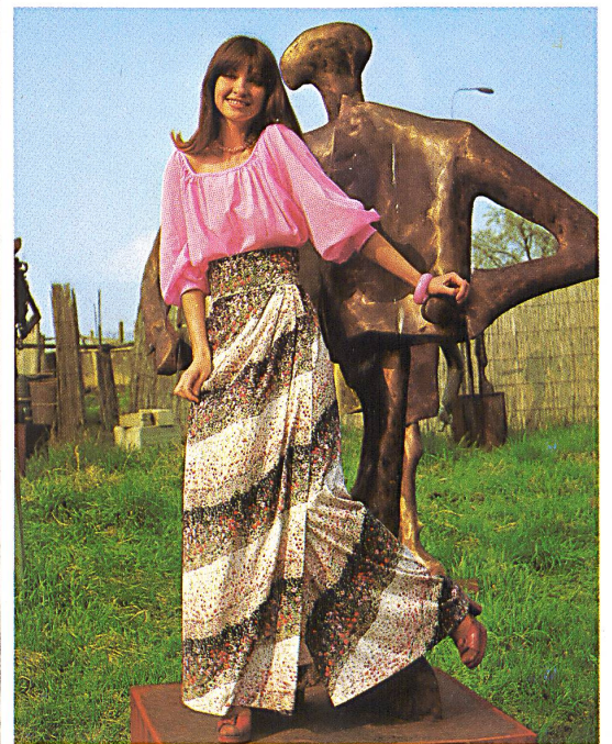
△ Bluse aus uni Baumwollvoile mit Jupe aus bedrucktem Baumwolljersey « Topas » / Blouse en voile de coton uni portée avec jupe en jersey de coton « Topaze » / Blouse in plain cotton voile with skirt in "Topas" cotton jersey print. (Margot, St. Gallen)