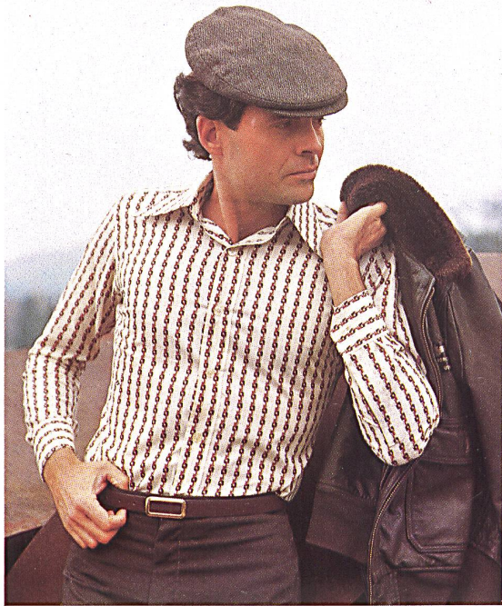
▽ Bedruckter Baumwollbatist « Arlette » / « Arlette », batiste de coton imprimée / "Arlette" cotton batiste print.