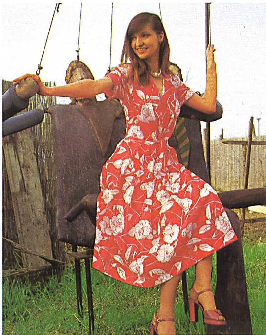
« NELO » J.G. NEF + CO. AG, HERISAU