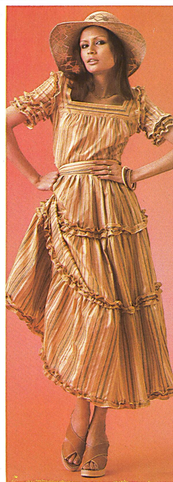
Romantisches Kleid aus dem feinen Baumwollbatist « Flavia » mit Satinstreifen. Robe romantique en fine batiste de coton « Flavia » à rayures satin. Romantic dress in "Flavia" fine cotton batiste with satin stripes.