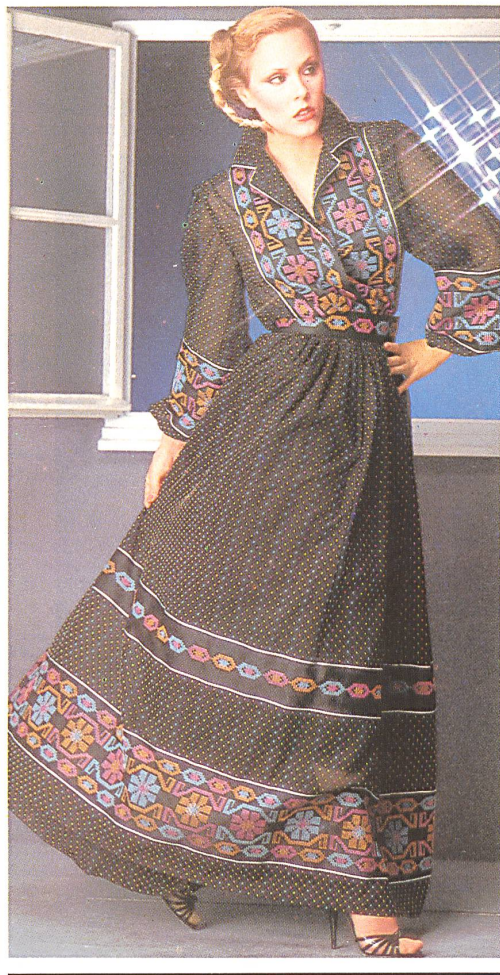
△ REICHENBACH + CO. AG. ST. GALLEN Colour-woven dotted design and cross-stitch edging on cotton / Buntgewebtes Punktedessin und Kreuzstichbordüre auf Baumwolle / Dessin de points tissés en couleur et bordure au point de croix sur coton.