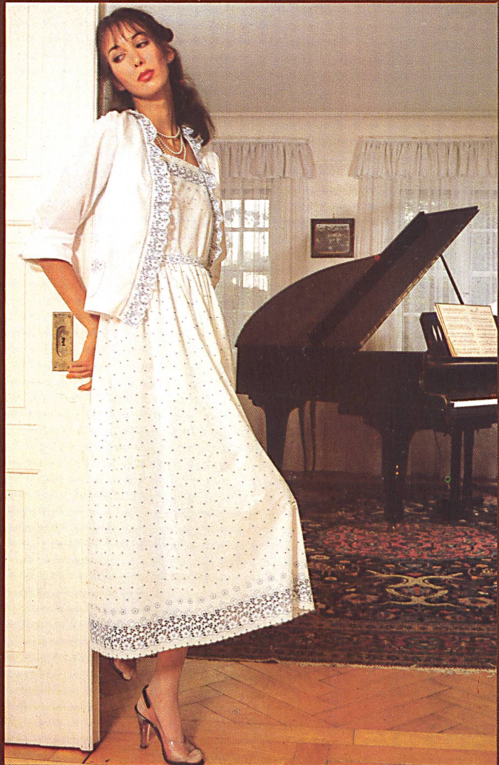
△ Farbige Richelieustickerei mit assortiertem Galon auf Baumwollbatist. Coloured Richelieu embroidery with matching braid on cotton batiste.

Die Firma Jacob Rohner AG, Rebstein, bringt ein von der Jahreszeit unabhängiges variationenreiches Stickerei-Programm, das in einzelne Themenkreise unterteilt ist. Dabei sind die verschiedenen Artikel jedes Sortimentes farblich und dessinmässig aufeinander abgestimmt: in der Kombination äusserst anregend, in der Verarbeitung für den Konfektionär völlig problemlos. Eine grosse Gruppe ist der Richelieustickerei nachempfunden mit ausgeprägtem Handarbeitscharakter, wobei die Dessins der Nouveautés von den Allovers mit Bordürenabschluss über Volants, Bänder und Galons in verschiedenen Breiten bis zu den Taschen und Einsätzen entweder Ton-in-Ton auf rustikalem Baumwolltoile oder farbig auf Baumwollbatist gestickt sind. Eine weitere Spezialität ist Richelieustickerei auf Baumwoll-Cretonne