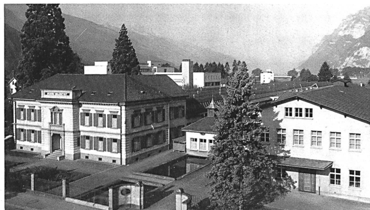
Schweizerische Gesellschaft für Tüllindustrie AG, Münchwilen