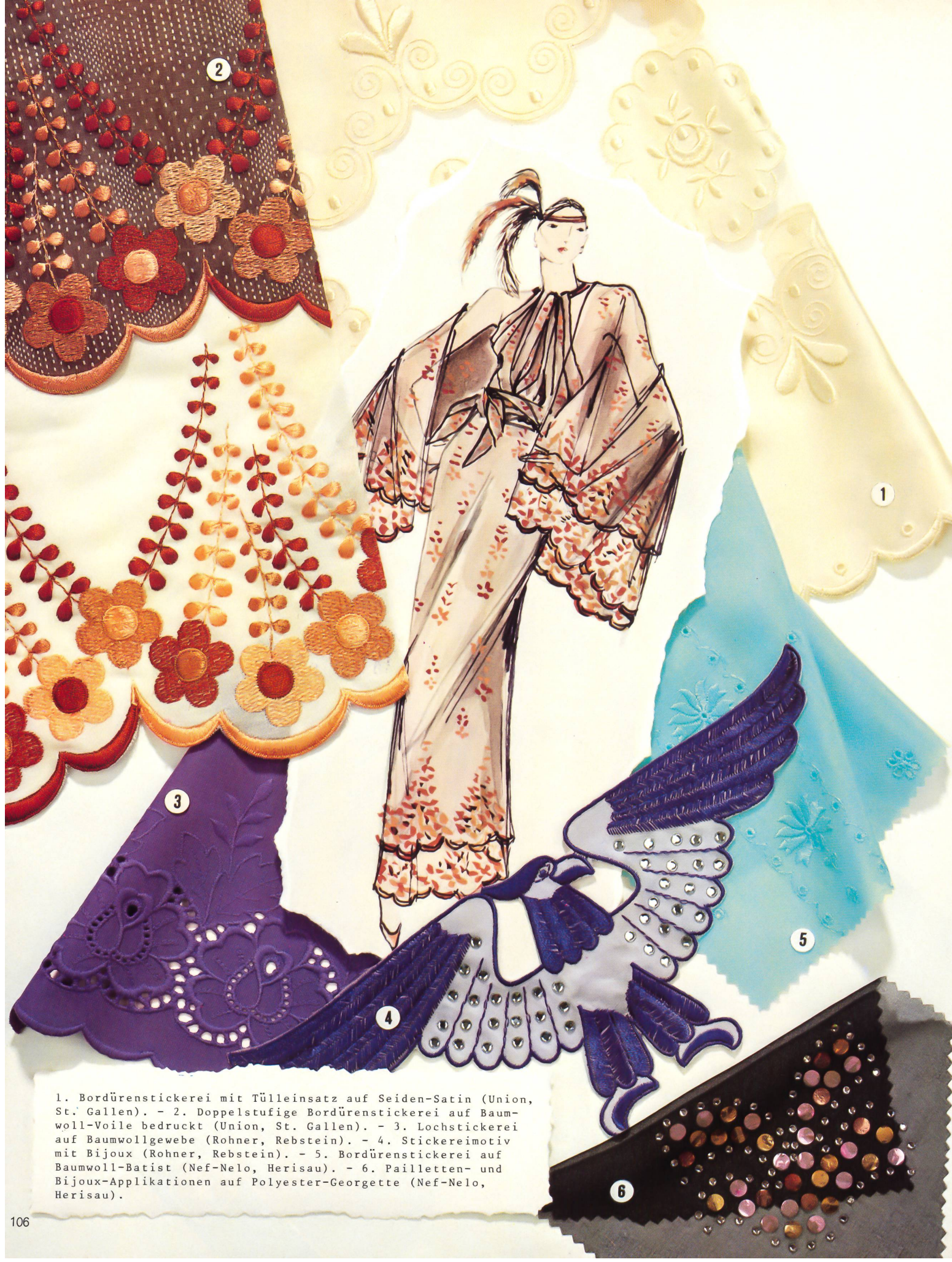
1. Bordürenstickerei mit Tülleinsatz auf Seiden-Satin (Union, St. Gallen). - 2. Doppelstufige Bordürenstickerei auf Baumwoll-Voile bedruckt (Union, St. Gallen). - 3. Lochstickerei auf Baumwollgewebe (Rohner, Rebstein). - 4. Stickereimotiv mit Bijoux (Rohner, Rebstein). - 5. Bordürenstickerei auf Baumwoll-Batist (Nef-Nelo, Herisau). - 6. Pailletten- und Bijoux-Applikationen auf Polyester-Georgette (Nef-Nelo, Herisau).