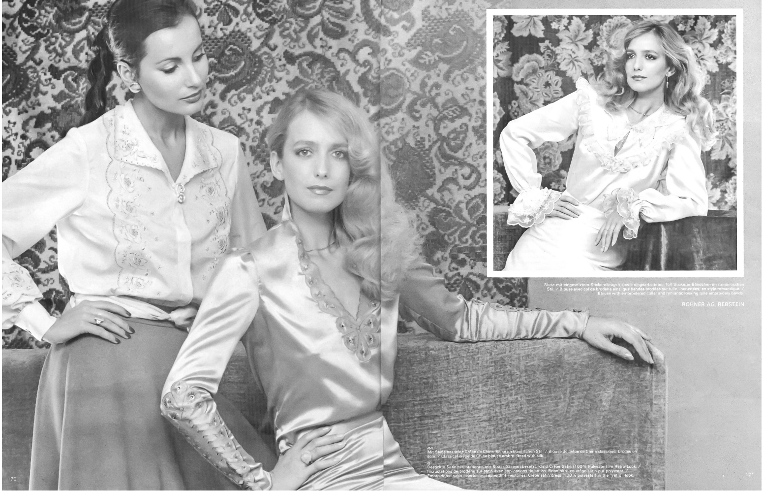
Bluse mit eingesetztem Stickereikragen, sowie eingearbeiteten Tüll-Steckerei-Bändchen im romantischen Stil. / Blouse avec col de broderie satin que bords brodés sur tulle romantique en style romantique. / Blouse with embroidered collar and romantic looking tulle embroidery bands.