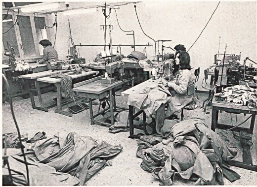
Texas SA in Stabio — 1977 gegründeter Façonneur-Betrieb mit 40 Beschäftigten. Hauptsächlich werden Jupes und Damenhosen, daneben noch Blusen und leichte Berufskleidung genäht. Kein eigener Zuschnitt. Der Hauptauftraggeber lastet die Firma etwa zu 50% aus.