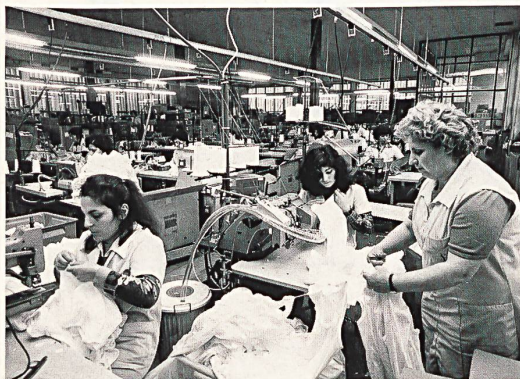
Wäschekonfektion der Sidema SA in Barico.