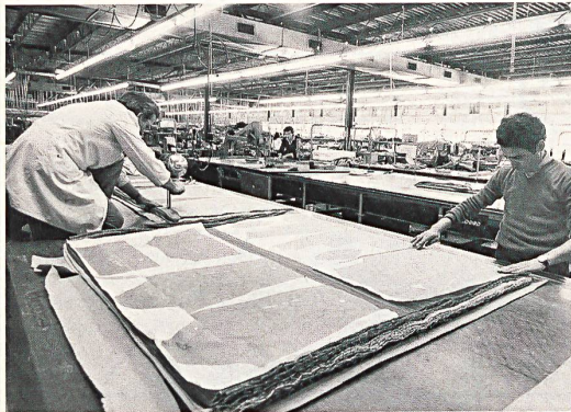
Lion d'Or SA in Stabio — Beispiel für die Zweiteilung: Kopf in Zürich (mit etwa 10 Personen). Fabrikation im Tessin (mit rund 190 Beschäftigten). Lion d'Or wurde 1939 gegründet und entwickelte sich zu einem der größten Damenkonfektionsunternehmen in der Schweiz. 1971 wurde die Produktion in die neuerstellte, für hochflexible Fertigung konzipierte und stets auf technisch modernstem Stand gehaltene Fabrik in Stabio verlagert.