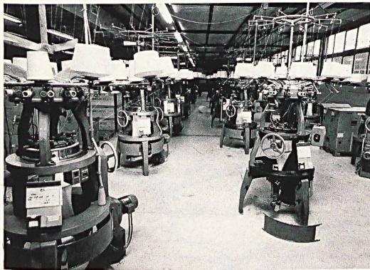
Sidema SA, traditioneller Tessiner Hersteller von gewirkter Baumwoll-Unterwäsche und T-Shirts für Damen, Herren, Kinder mit Hauptsitz in Barbengo und Konfektionsbetrieb in Barico. Die Firma wurde 1957 gegründet, bezog 1965 das heutige moderne Fabrikgebäude mit Computeranlage und eigener Druckerei für die Verpackung. Mit 270 in beiden Produktionsstätten beschäftigten Personen werden täglich 20 000 Wäschestücke, vom Gewirk bis zum verpackten Artikel, hergestellt. Rundstrickerei in Barbengo.