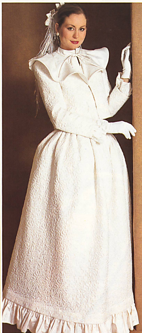
Broderie de Lurex® sur taffetas de soie ouatiné / Lurex®-Stickerei auf wattiertem Seidentaft / Lurex® embroidery on padded silk taffeta.