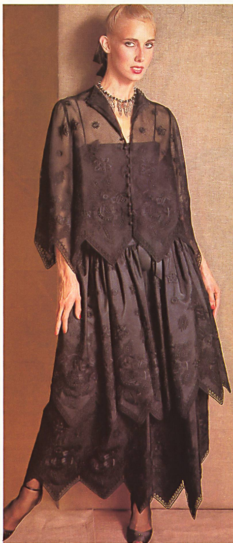
Broderie sur tulle résille avec ourlet découpé / Stickerei auf Résille-Gittertüll mit ausgeschnittenem Saum / Embroidery on fine lattice-work tulle with cut-out hem.