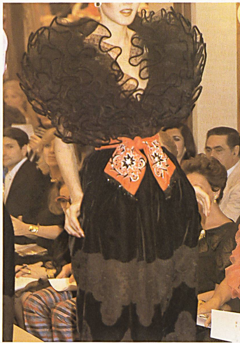
Galon de tulle de coton brodé, incrusté sur la jupe / Bestickter Baumwolltüll-Galon, im Jupe inkrustiert / Embroidered cotton tulle braid insertion on the skirt.