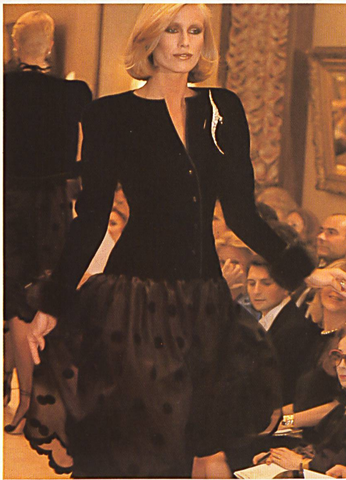
Organza de soie avec pois de velours appliqués et bord arqué, festonné, découpé / Seiden-Organza mit appliziertem Samttupfen und ausgeschnittenem, festonniertem Bogen-Abschluss / Silk organza with appliquéd velvet dots and cut-out scalloped hem.