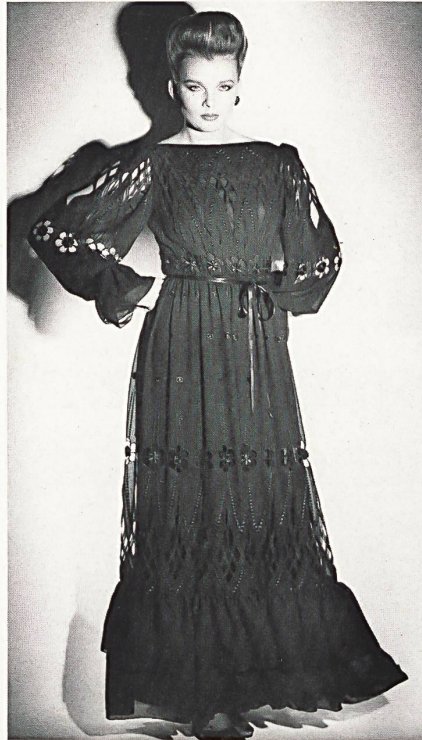
Weichfallender Georgette mit Durchbrucharbeit und Stickerei / Georgette au tomber souple avec travail de jours et broderie / Softly draping georgette with openwork and embroidery.