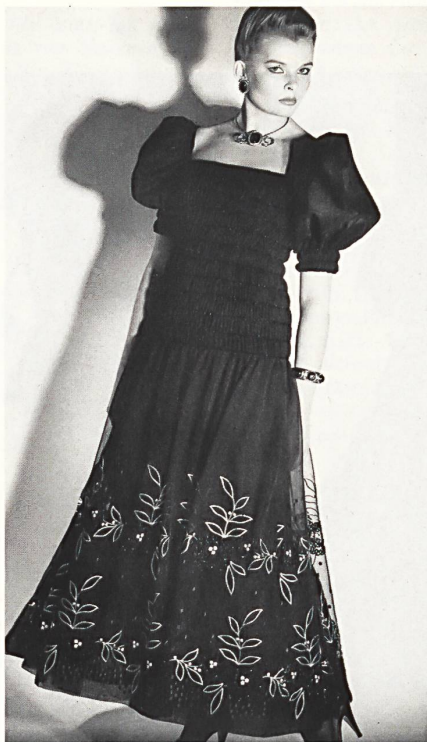
Lurex®-Stickerei in Gold und Schwarz auf Georgette / Broderie de Lurex® en or et noir sur georgette / Lurex® embroidery in gold and black on georgette.

den bevorzugten Lieferanten der renommierten Couturière. Sie will ihrer Kundschaft im Winter 1980/81 modisch kein X für ein U vormachen, doch schätzt sie die auch in Paris propagierte X-Linie sehr, gibt sie doch der Trägerin jene zierliche Silhouette, die Inbegriff aller Femininität ist. Schmale Kostüme mit leicht verbreiterten Schultern, enggegürtete Taille und glockigschwingenden Jupes sind Favoriten, dazu werden schmeichelnde Capes assortiert. Zu den aktuellen Wendemänteln – Seiden-Popeline und Pelz – gehören plissierte Chemisiers und weichwirkende, mitunter mit Volants versehene Nachmittags-Kleider. Folkloristische, speziell russische Akzente sind öfters anzutreffen und beleben die Szene der klassischen Eleganz.