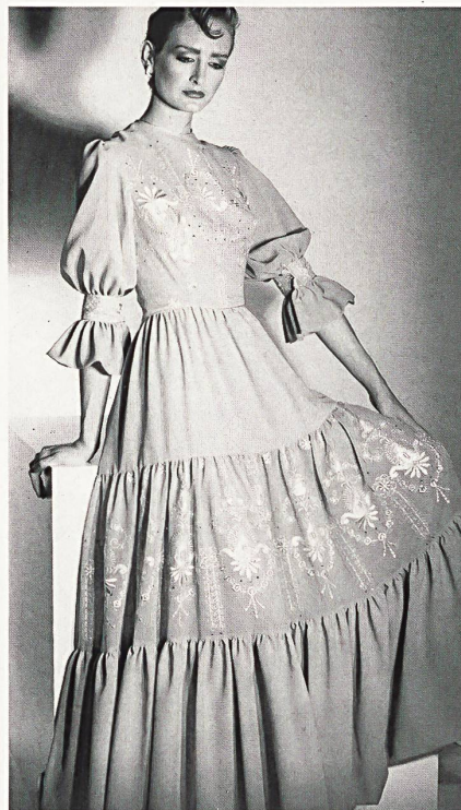
Silber-Lurex®- und Seiden-Stickerei auf türkisfarbenem Georgette / Broderie en Lurex® argent, et soie, sur georgette turquoise / Silver Lurex® and silk embroidery on turquoise georgette.