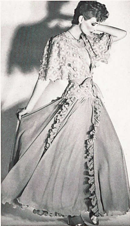
Seidenglanz-Stickerei mit reichen Guipure-Blüten-Applikationen / Broderie en soie brillante avec riches applications de guipure florale / Silky shimmering embroidery with rich guipure floral applications.

hier wie überall Transparenz gross geschrieben wird. Nicht minder aktuell sind jedoch zarte Aubergine-Töne, sanftes Perlgrau und Türkis, alle Pastell-Nuancen sowie bei den für die Tagesmode höchst beliebten Schotten-Karos etwas intensivere, kontrastierende Farben. Die Kollektion von Toni Schiesser gehört zu der im besten Sinn des Wortes tragbaren Mode, doch zeigt sie niemals konfektionsmässige Konzessionen. Stets gibt man sich in Frankfurt anspruchsvoll und modisch up-to-date, und betont den hohen Genre des Angebotes mit ausgesuchten Textilien.