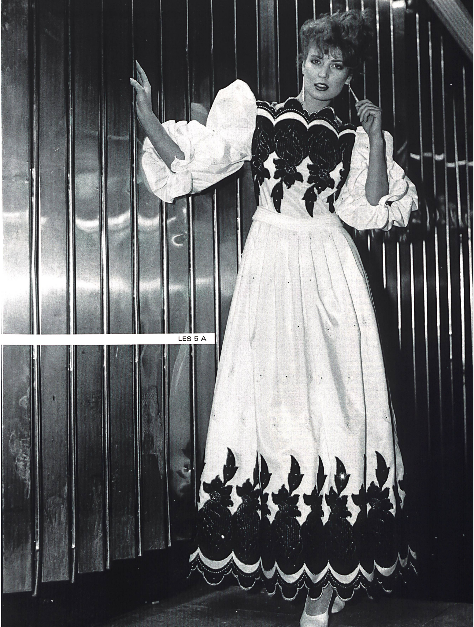
LES 5 A