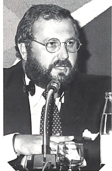
Gianfranco Ferré , Créateur, Mailand